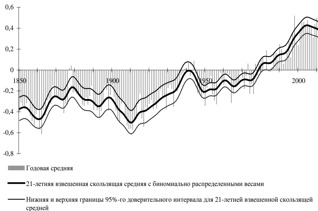
Рис. 1. Отклонение средней годовой температуры воздуха от нормы 1 , 1850–2011 гг., °С

нии научного консенсуса, подтверждающего важную роль антропогенного фактора. Так, согласно исследованию Университета Иллинойса, среди 3146 исследователей (геофизиков, климатологов и др.), активно публикующих научные работы по проблеме климатических изменений, 97% согласны с тем, что человеческая деятельность является значимым фактором, вносящим вклад в глобальное изменение климата [14].