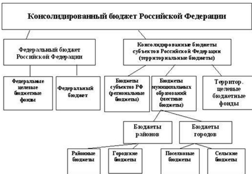
Рисунок А 1. – Структура консолидированного бюджета Российской Федерации.

Консолидированный бюджет не подлежит утверждению в законодательном порядке, его данные используются в аналитических целях, например для определения совокупных доходов и расходов РФ и субъектов, сопоставления бюджетов субъектов РФ, их источников доходов и направлений расходов, объемов бюджетного дефицита и источников их финансирования, выявления особенностей функционирования бюджетов отдельных субъектов РФ и муниципальных образований.