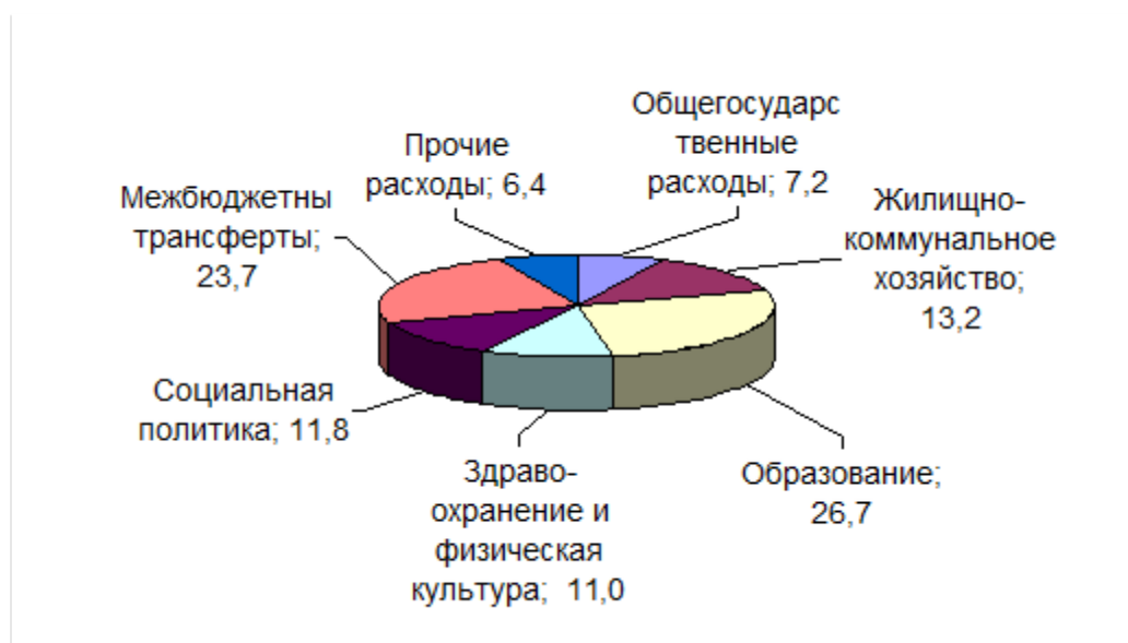
Рисунок А 3. Структура расходов местного бюджета в 2019 г., %

Структура расходов местного бюджета 2019 года отличается от структур расходов 2017 года и 2018 года, тем, что добавились межбюджетные трансферты, доля которых составила 23,7% от общего объема расходов бюджета или 123735 тыс.руб.