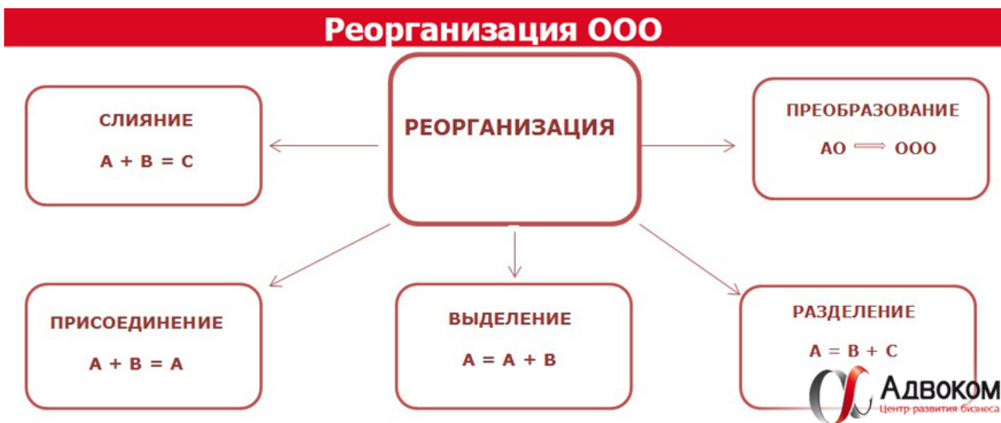
Рисунок 2. Схема видов реорганизации юридических лиц

Схематично виды реорганизации представлены на рисунке 2[27]