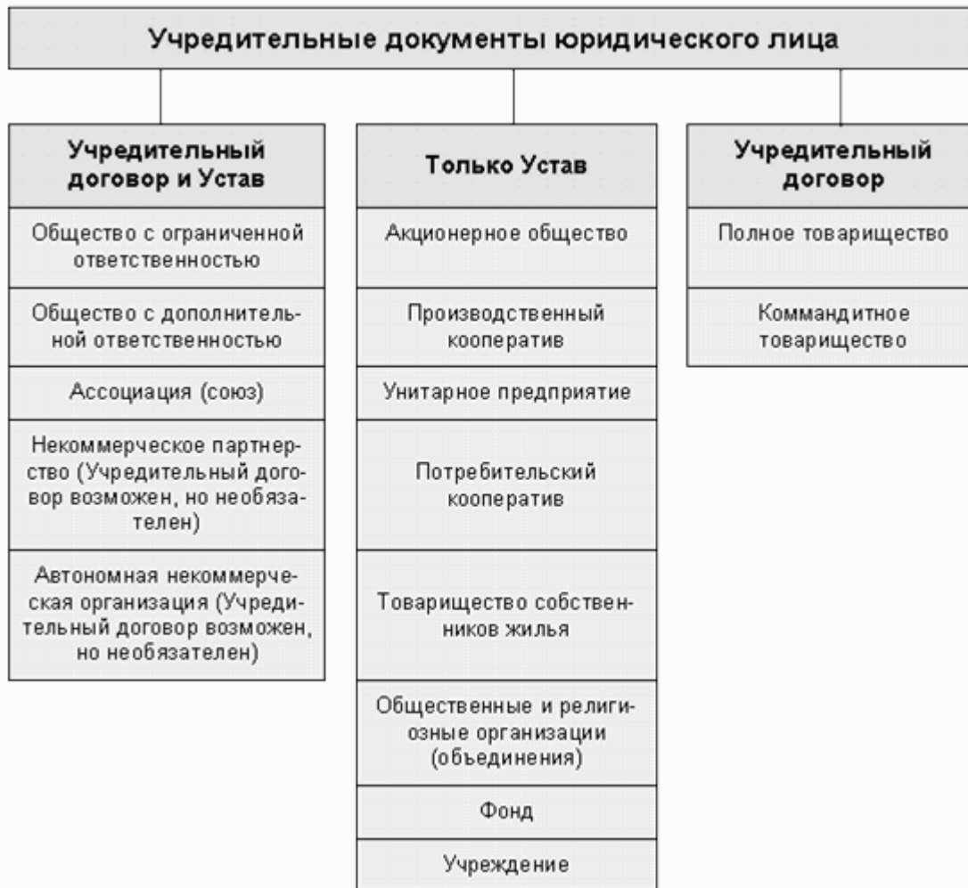
Рис. 1 - учредительные документы