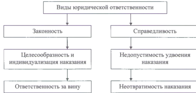
Рисунок 2. Принципы юридической ответственности