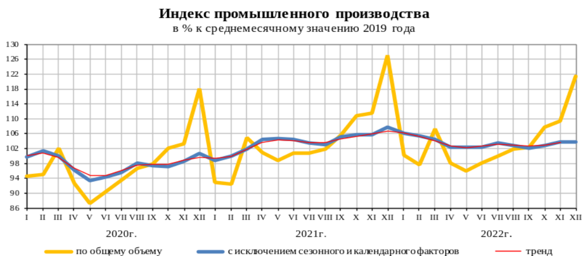
Рис. 2- Индекс промышленного производства Российской Федерации

Ещё одна из проблем обеспечения экономического роста в России - сокращение промышленного производства. Объемы промышленного производства в декабре 2022 года сократились по сравнению с аналогичным периодом 2021 года на (-)4,3%. При этом по сравнению с ноябрем 2022 года отмечен рост на (+)10,9%. В целом в 2022 году промышленное производство снизилось на (-)0,6% по сравнению с 2021 годом. 2