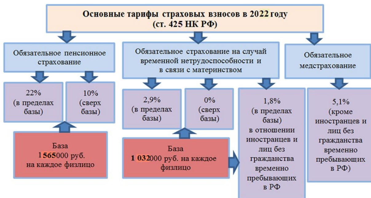
Рисунок 2 – Тарифы страховых взносов

Составление отчетности по страховым взносам на ОПС, ОМС и ВНиМ происходит на бланке, утвержденном приказом ФНС от 06.10.2021 № ЕД-7-11/875@.