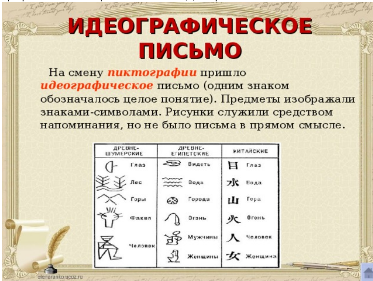
Рис.2 Идеографическое письмо

порядку слов в речи. Предметы изображались либо символическими знаками, либо графическими изображениями: птица, зверь.