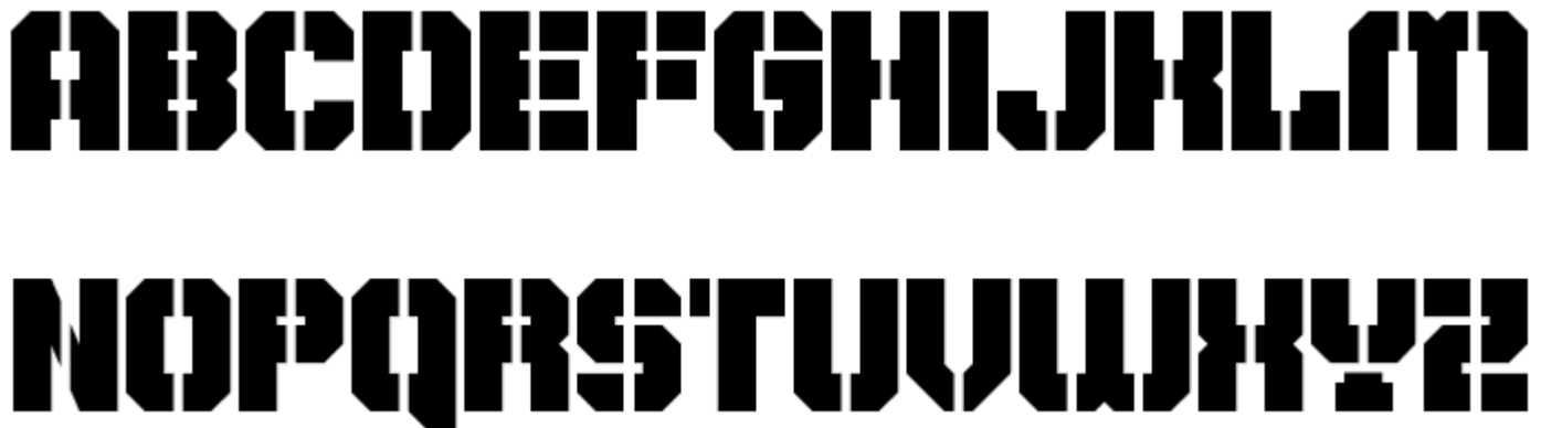
Рис.16 Неизвестные шрифты

II. Более полно и конкретно описание шрифтов по системе IBM Classification (оно и более приближено к исторической классификации):