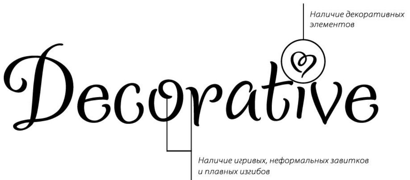
Рис.15 Декоративный шрифт