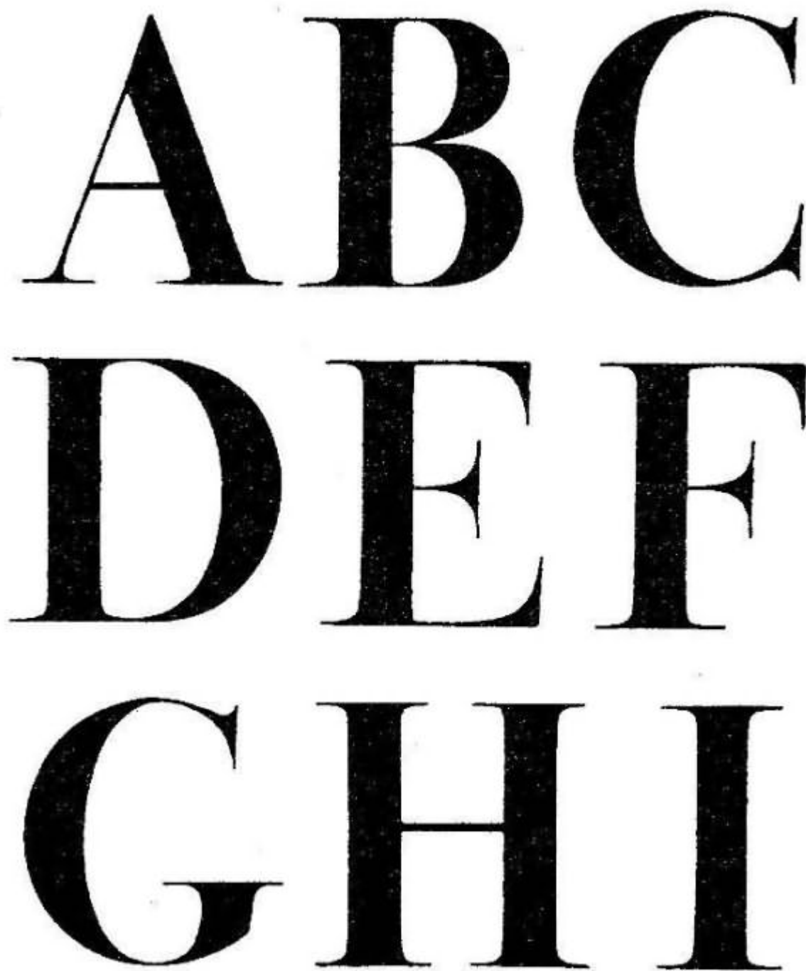
Рис. 10 Контрастный шрифт

Вот важнейшие графические элементы, из которых буквы построены: