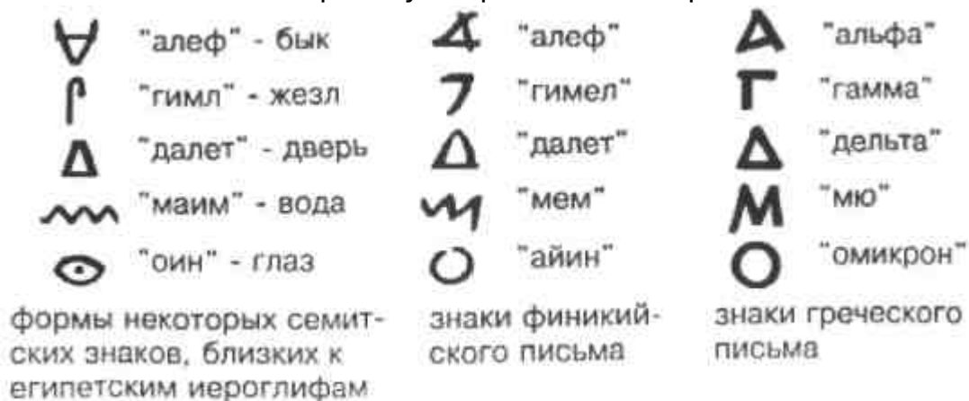
Рис.4 Буквенно-звуковое письмо

до н. э.) Предполагается, что структура графем исторически связана с иероглифическими изображениями, что подтверждается также исходными наименованиями некоторых букв греческого алфавита.