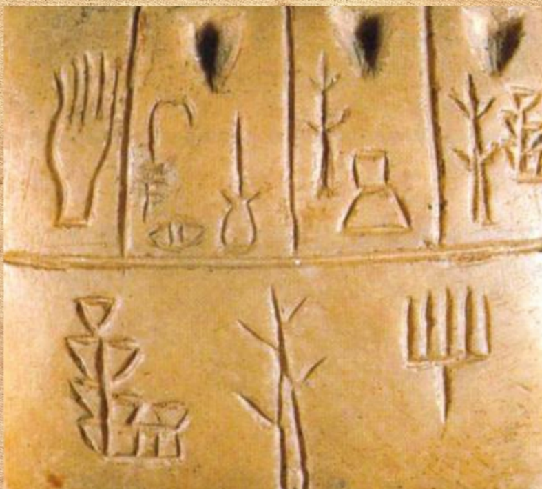
Рис.1 Пиктографическое письмо

Идеографическое письмо (рис.2). Значительно позже, в эпоху образования государств и развития торговли, в Китае и в Египте на смену пиктографическому письму пришло идеографическое, т. е. письмо при помощи идеограмм, а не букв. Одним письменным знаком обозначалось целое слово. Это уже была система графических форм, поскольку последовательность знаков соответствовала