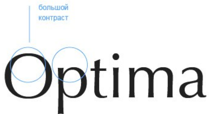
Рисунок 8. Гуманистические гротески

Самые знаменитые гуманистические гротески – Gill Sans, Frutiger, Tahoma, Verdana, Optima, и Lucide Grande.