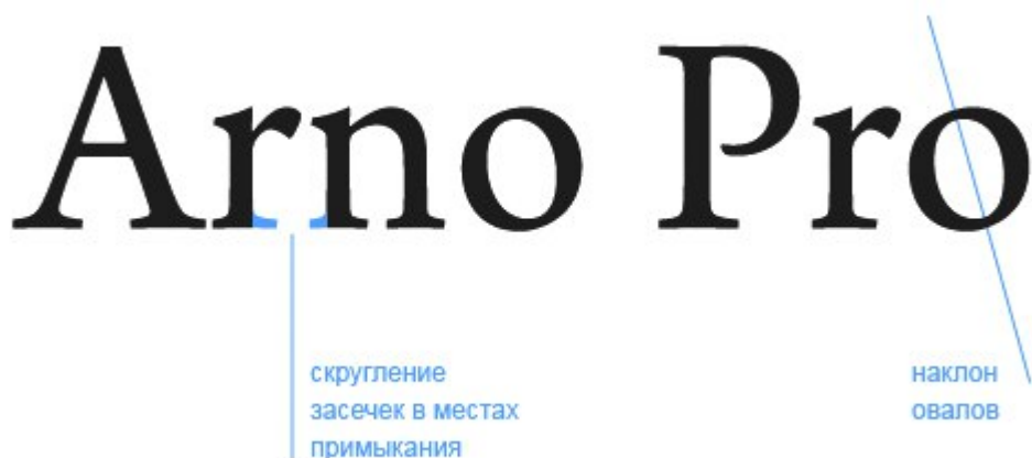
Рисунок 2. Антиква старого стиля

Главная особенность антиквы старого стиля – это наклонные овалы у букв и несимметричные засечки. Пример такого шрифта – Adobe Garamond Pro. Текст, набранный им, сразу же обретает изысканный стиль и красивое книжное настроение.