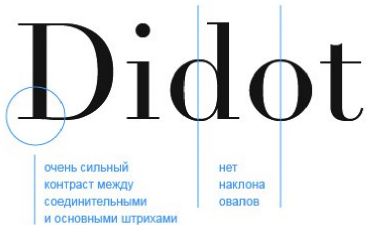
Рисунок 4. Антикva нового стиля

Самые знаменитые антиквы нового стиля – это шрифты Bodoni, Didot, Walbaum. Их можно использовать для тех же целей, что и переходные: при печати книг, документов, писем и официальных заявлений.