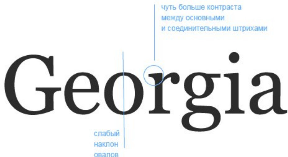
Рисунок 3. Переходная антиква

К переходной антикве мир перешел в конце XVII – начале XVIII веков. Считается, что первая переходная антиква создавалась для нужд французского короля Людовика 14, и отличается от старой антиквы большим контрастом букв и симметричными засечками.