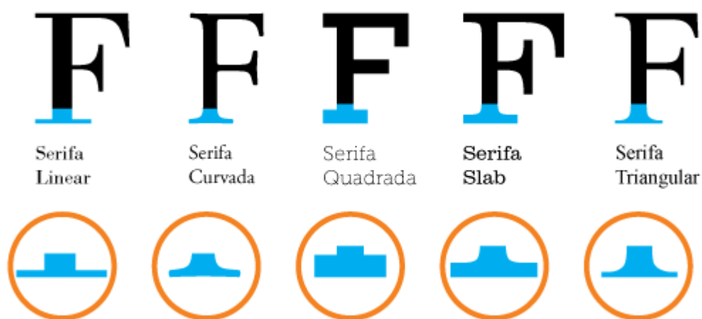
Рисунок 1. Виды засечек

Засечки, или серифы – это такие «подковы» у букв, благодаря которым шрифт выглядит более законченным и устойчивым. Раньше засечки помогали делать более качественный оттиск при печати в типографии и не изнашивать сами буквы. Сегодня считается, что засечки помогают чтению, так как взгляд цепляется за рисунок букв и слова не слипаются в кашу.