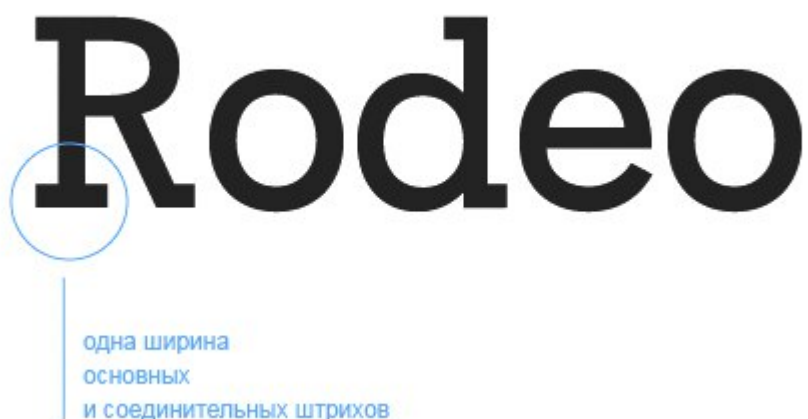
Рисунок 5. Брусковая антиква