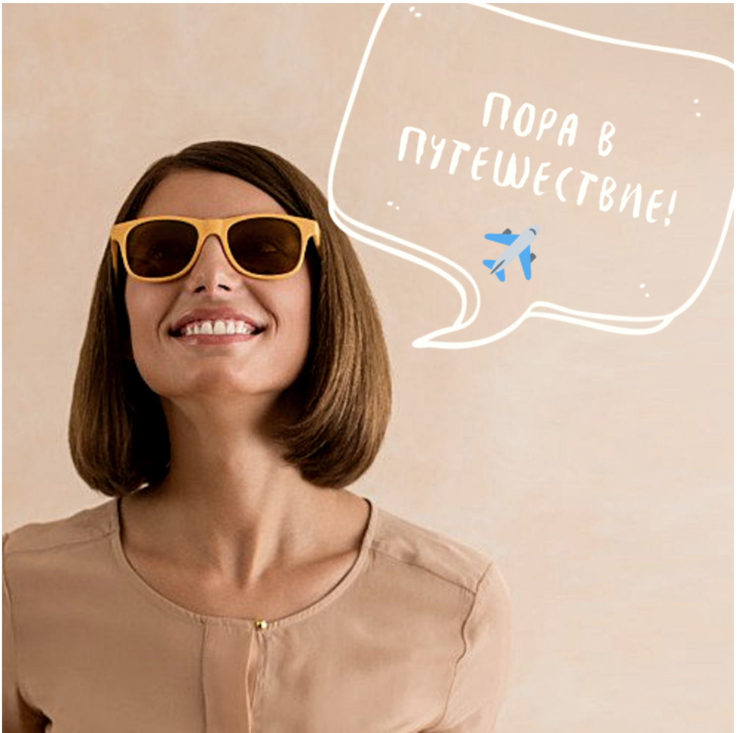
Рисунок 15. Небуквенный шрифт