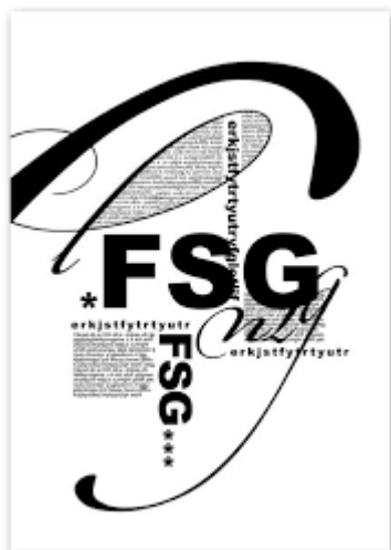
Рис. 2. Шрифтовая композиция

Уже на первой стадии ведения работы должны быть представление о том, что главенствует в композиции - шрифтовые или изобразительные элементы. Как они будут соотноситься между собой и что это соотношение эмоционально выразит. Единство элементов шрифта и изображения - залог создания успешной композиции. (См. Рис. 2)