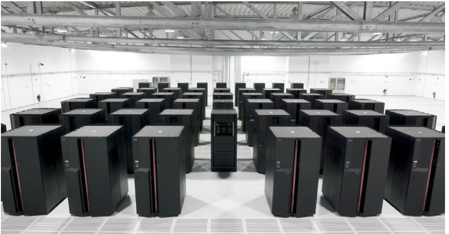
Китайский суперкомпьютер Tianhe-1A