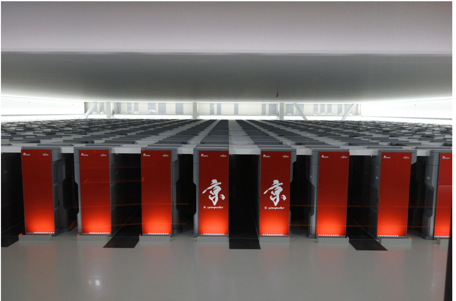
Японский суперкомпьютер FUGAKU