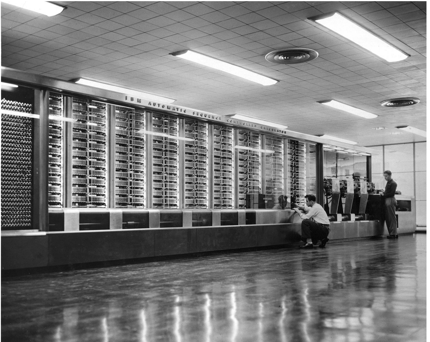
«Mark I» в Гарварде