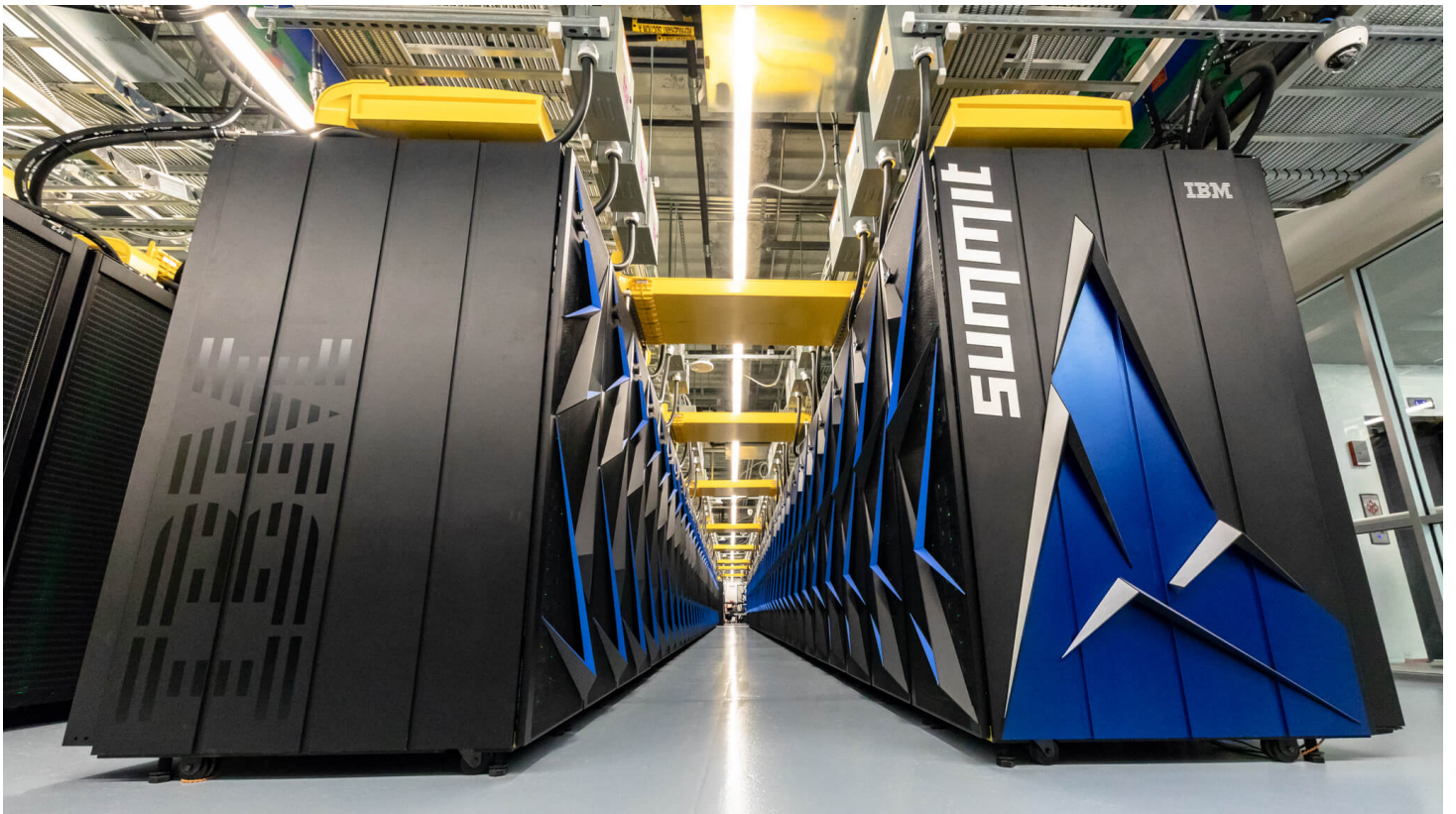
Американский суперкомпьютер SUMMIT