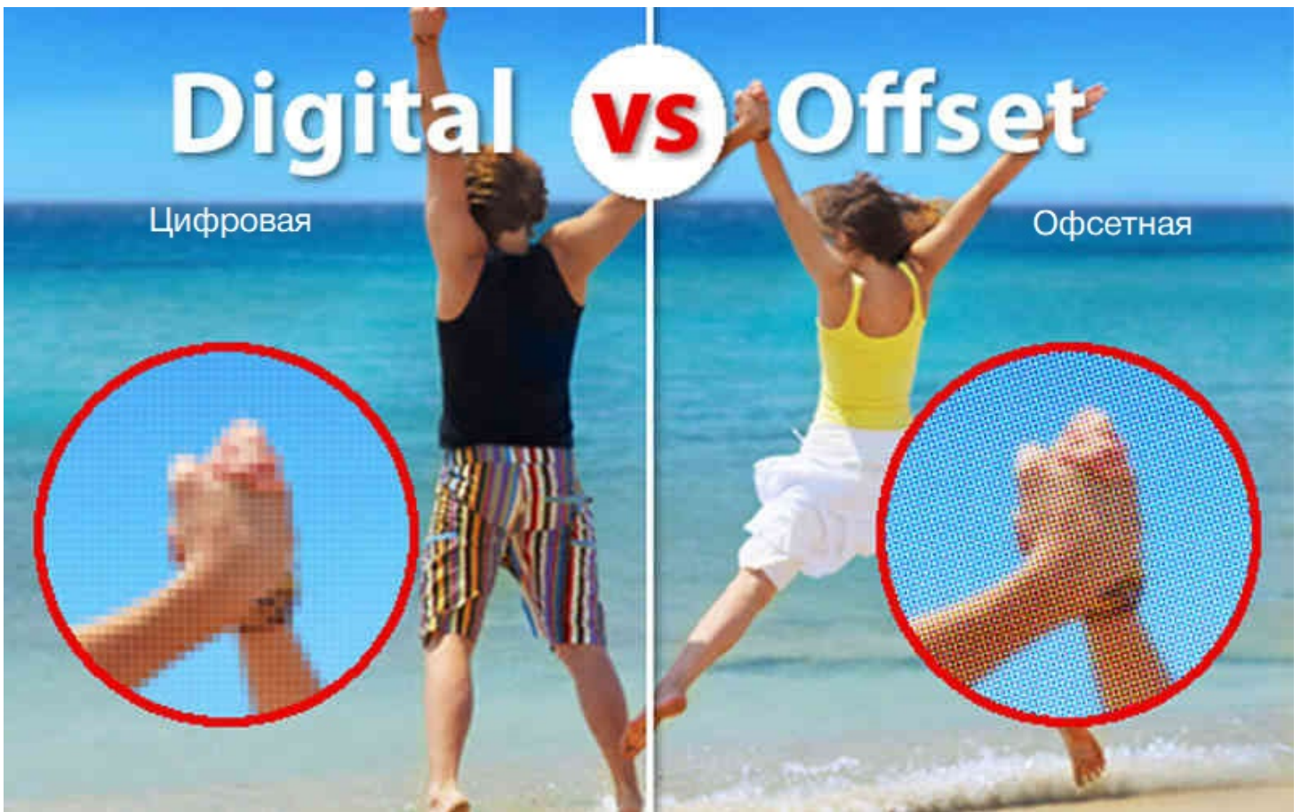
Рис. 4 Разница между цифровой и офсетной печатью

Разработки меняют относительную стоимость позиций цифровой и офсетной печати (см. рис. 4). Как правило, экономическая точка пересечения становится все выше, и это будет стимулировать дальнейшее внедрение цифровых технологий за счет существующих альтернативных решений для лито, флексографии и глубокой печати.