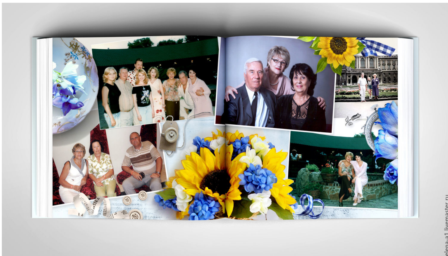
Рис. 5 Фотокнига

Также открываются новые рынки, такие как фотокниги и фотопродукция, где цифровая печать, связанная с онлайн-заказами, позволила процветать рынку с многомиллиардным оборотом.