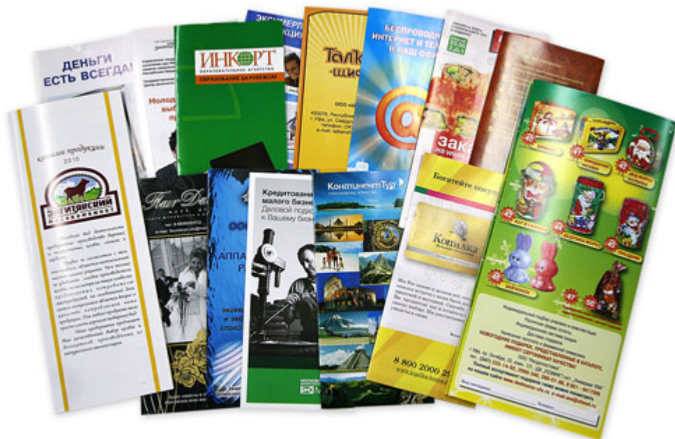
Рис. 8 Рекламная продукция