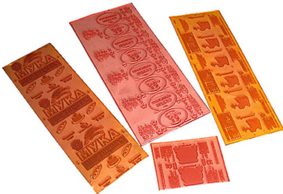
Рис. 2 Печатная форма

сокращению времени обработки и снижению стоимости при использовании цифровой печати, но обычно приводит к потере некоторых мелких деталей изображения в большинстве коммерческих процессов цифровой печати. Самые популярные методы включают струйные или лазерные принтеры, которые наносят пигмент или тонер на широкий спектр материалов, включая бумагу, фотобумагу, холст, стекло, металл, мрамор и другие вещества.