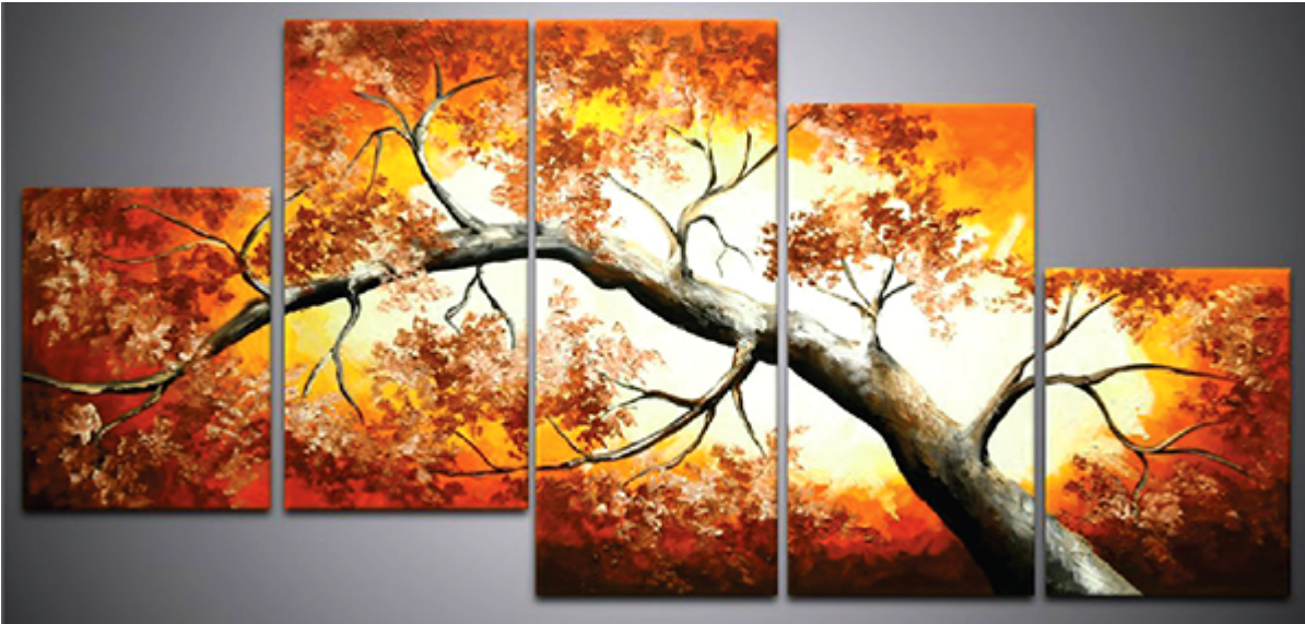
Рис. 6 Художественная печать

Были эксперименты со многими из этих типов принтеров, наиболее заметным из которых был принтер IRIS, первоначально адаптированный для печати изобразительного искусства программистом Дэвидом Кунсом, и принятый для художественных работ Грэмом Нэшем в его типографии Nash Editions в 1991 году. Первоначально эти принтеры были ограничены глянцевой бумагой, но графический принтер IRIS позволял использовать различные виды бумаги, которые включали традиционные и нетрадиционные носители. В течение многих лет принтер IRIS был стандартом для создания цифровых печатных произведений изобразительного искусства и до сих пор используется, но его заменили широкоформатные принтеры других производителей, таких как Epson и HP, в которых используются устойчивые к выцветанию архивные чернила (пигментные краски) на основе.