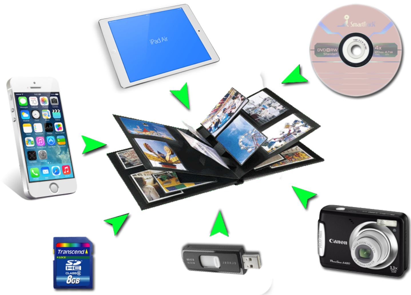
Рис. 1 Носители для цифрового изображения

офсетной печати, но эта цена обычно компенсируется, избегая затрат на все технические этапы, необходимые для изготовления печатных форм. Он также позволяет печатать по требованию, в короткие сроки и даже модифицировать изображение (переменные данные), используемое для каждого показа. Экономия труда и постоянно растущие возможности цифровых печатных машин означают, что цифровая печать достигает того уровня, когда она может совпасть или превзойти способность технологии офсетной печати производить большие тиражи в несколько тысяч листов по низкой цене.