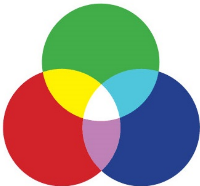
(рис. 1 — система RGB)

В системе RGB все оттенки спектра получаются из сочетания трех основных цветов: красного, синего и зеленого (Red, Green и Blue), заданных с разным уровнем яркости. Эта система является аддитивной, то есть в ней выполняются правила сложения цветов. Сумма трех основных цветов при максимальной насыщенности даст белый цвет, а при нулевой — черный. Красный и зеленый цвета образуют желтый, а зеленый и синий — голубой.