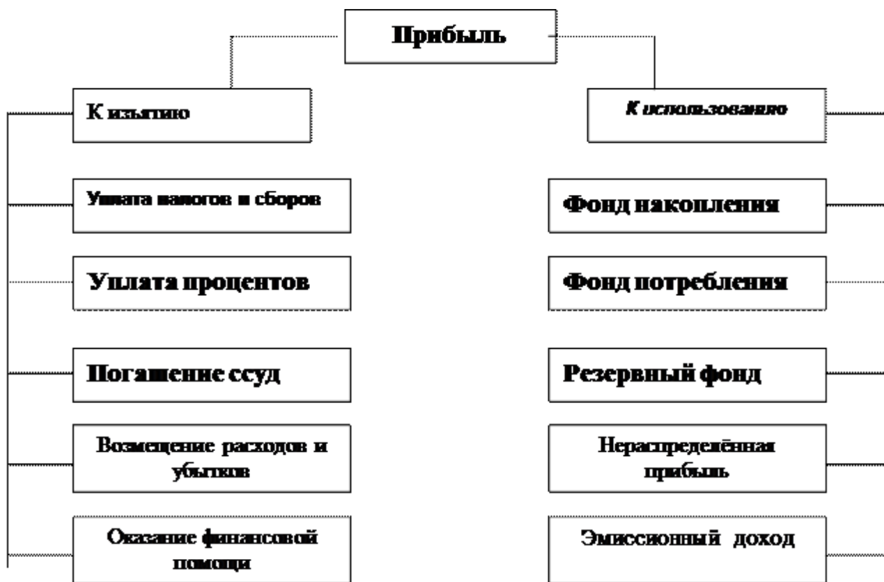
Рис. 1.1. Схема участия прибыли в распределительном процессе

Прибыль – основной объект реализации распределительной функции финансов предприятия. За счёт прибыли формируется целая совокупность фондов денежных средств. На схеме показаны два основных канала участия прибыли в распределительном процессе, определяющих пропорции, в которых прибыль изымается и используется самим предприятием.