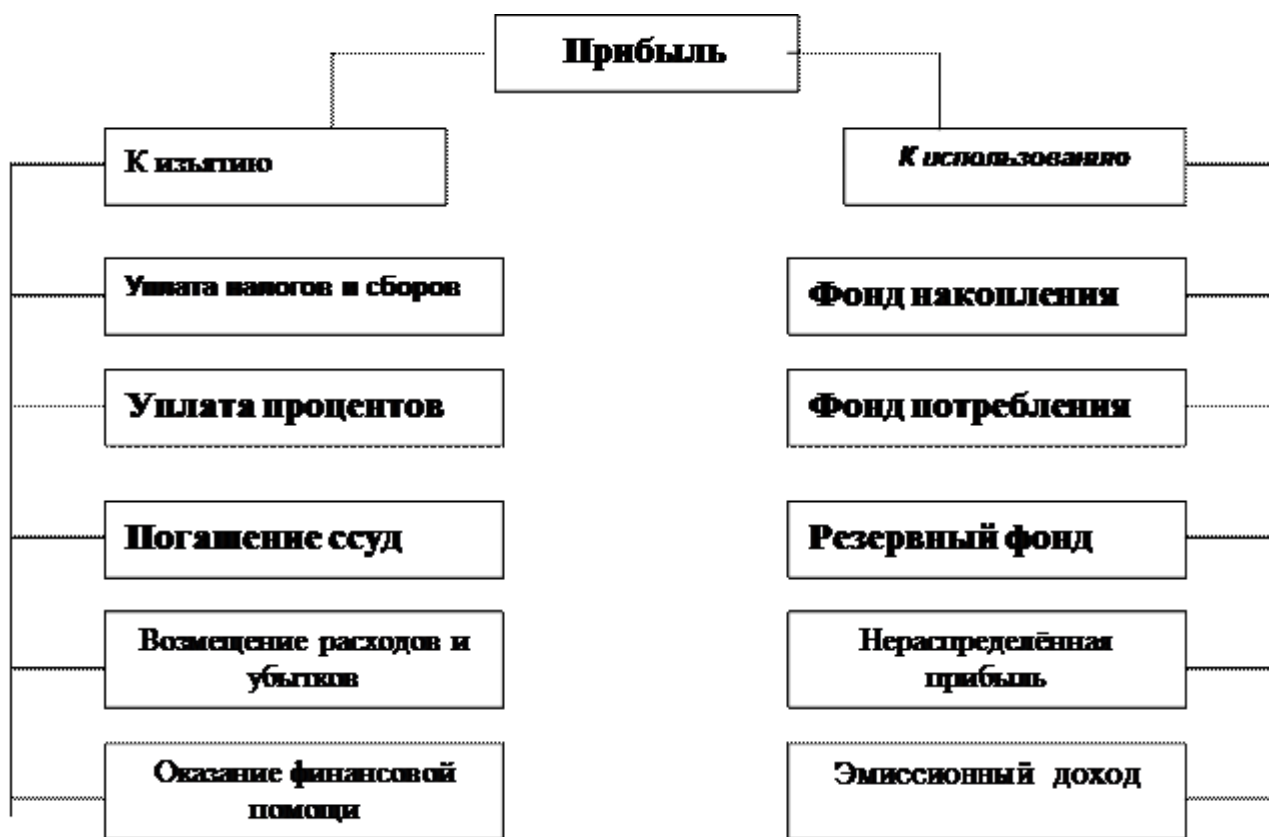
Рис. 1.1. Схема участия прибыли в распределительном процессе

Прибыль – основной объект реализации распределительной функции финансов предприятия. За счёт прибыли формируется целая совокупность фондов денежных средств. На схеме показаны два основных канала участия прибыли в распределительном процессе, определяющих пропорции, в которых прибыль изымается и используется самим предприятием.