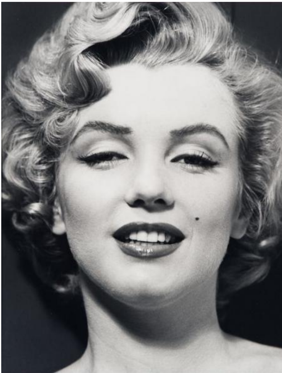
рис 3. Фото портрет Мерлин Монро