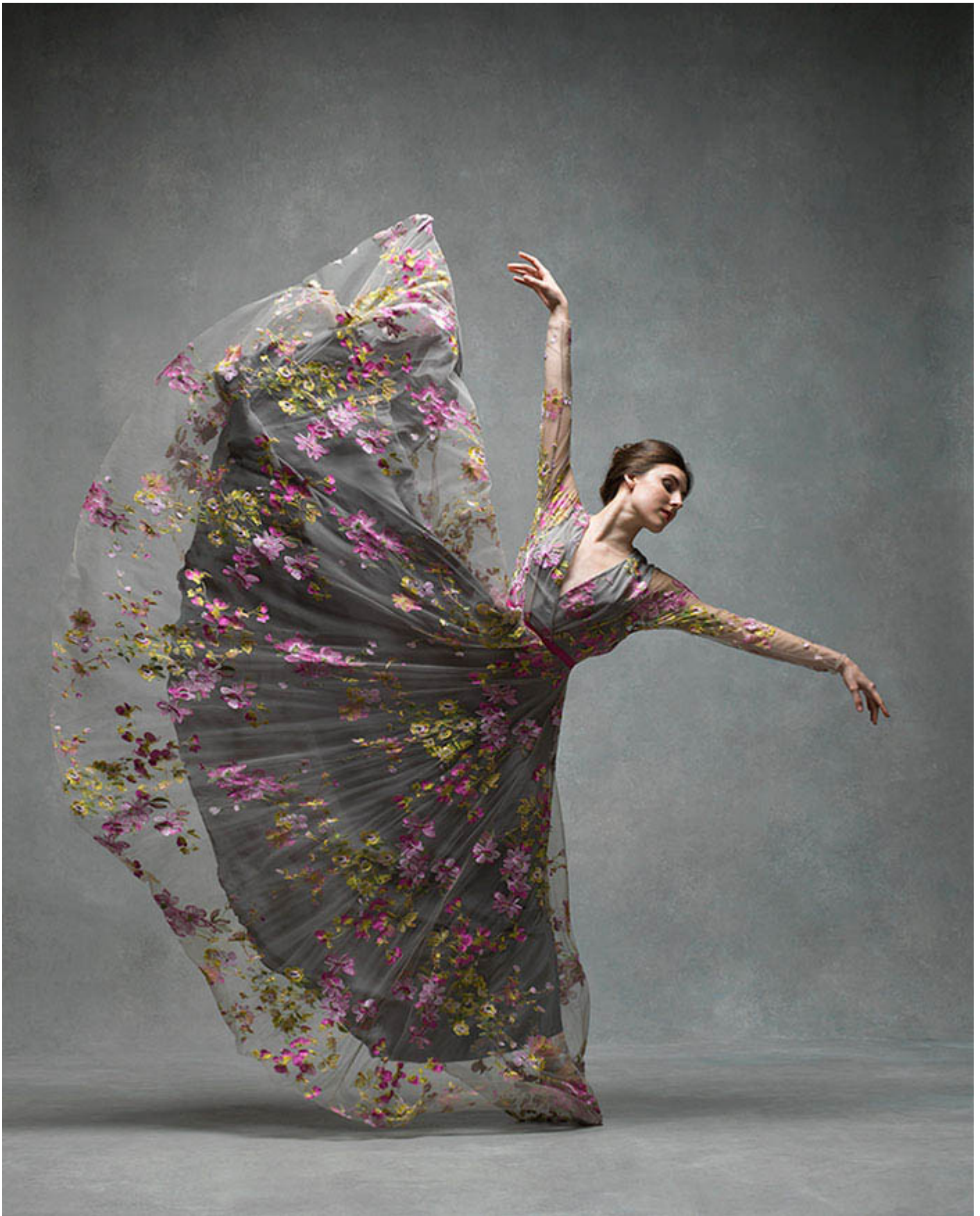
рис 4. рис 5. рис 6.