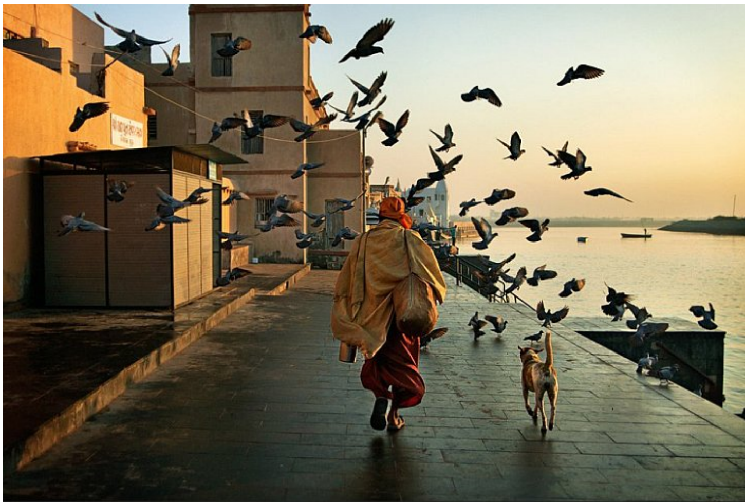
рис 9. Паломник, Аллахабад, Индия, 2006

Искусство фотографии - одна из самых замечательных форм искусства в современном мире. Часто люди путают понятия со страстью к фотографии и своими изображениями. Любовь к фотографированию - это не просто фотографии, которые я нахожусь в машине или на работе. Это возможность остановить время. В потрясающем моменте, выразить все что вы чувствуете одной фотографией— вот в чем заключается умение фотографировать. Ради этого стоит учиться фотографировать.