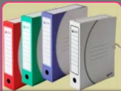
Папка с завязками