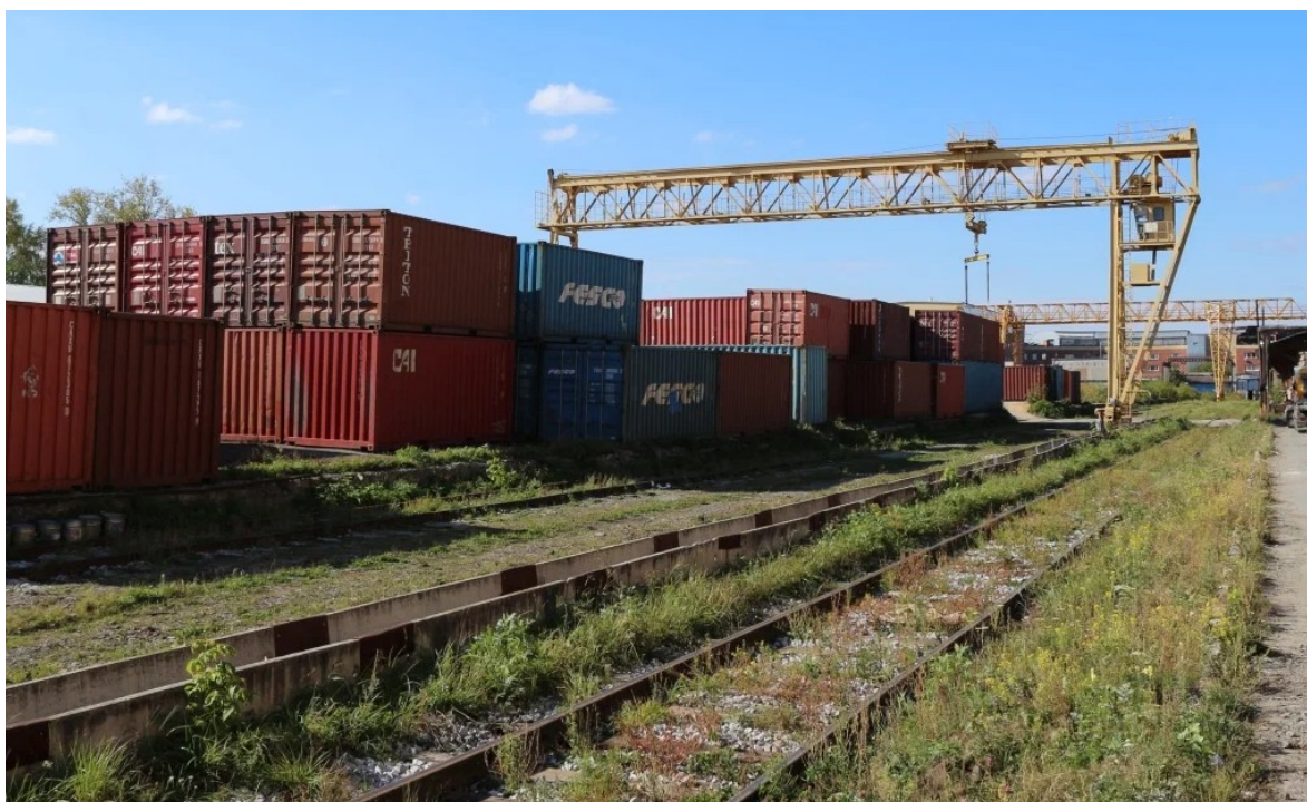
Рис 1 - Фото станции Екатеринбург-Товарный