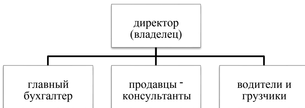
Рисунок 14 – Организационная структура управления

Коллектив стабилен, люди не увольнялись и не принимались в течение года. Связано это со многими факторами, в т.ч. и с отсутствием работы в городе, но в целом такая ситуация может рассматриваться только как положительная.