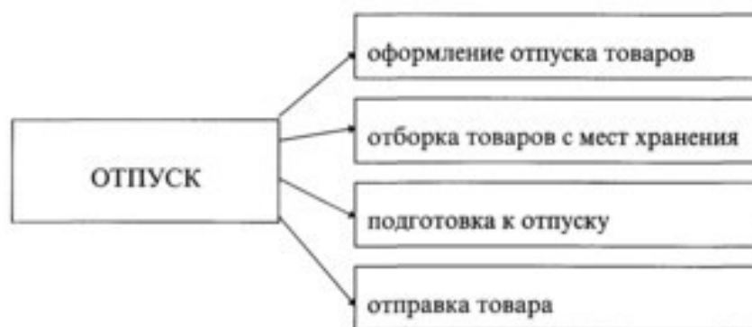
Рисунок 19 – Операции по отпуску товаров

Продажа – это последний этап в движении товаров, т.е. выполняется операция отпуска товаров по установленным ценам. Общая схема процесса и обработки представлена на рисунке 19.