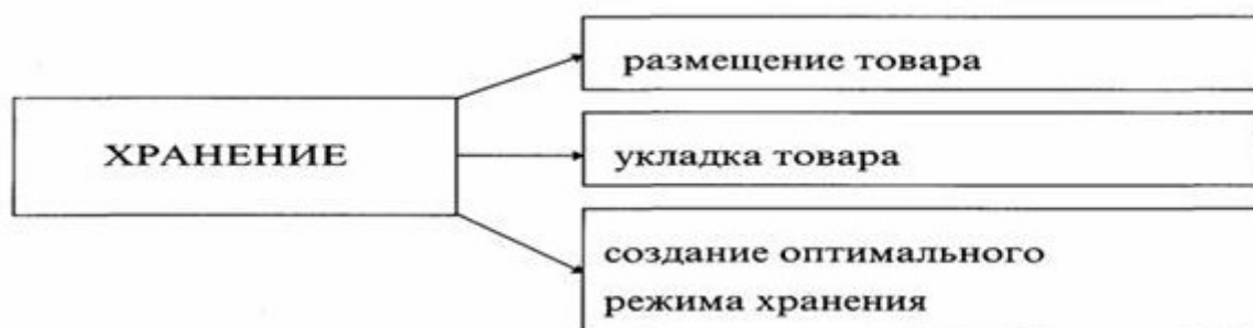
Рисунок 17 – Операции по размещению товаров на складе

Общие направления операций, связанных с размещением товаров на складе, представлены на рисунке 17.