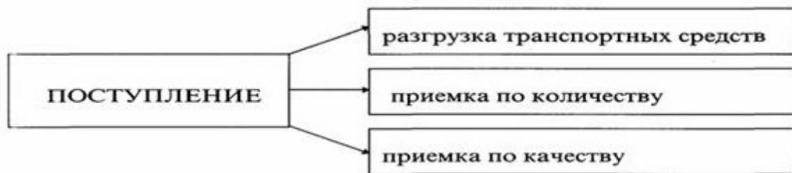
Рисунок 15 – Основные виды работ при поступлении товаров