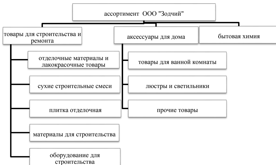
Рисунок 12 – Ассортимент товаров в ООО «Зодчий»

Потребление значительно подвержено сезонным колебаниям, что связано с тем, что 2 и 3 кварталы – это традиционные периоды ремонтных работ. Существенное повышение удельного веса в группе «Аксессуары для дома» в 4 квартале составило 34,86%, что связано с приближением праздников и стремлением людей приобрести подарки.