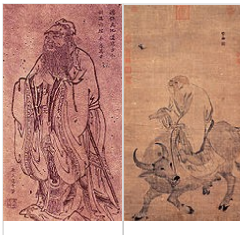
Конфуций , гравюра У Даоцзы ,

Древнекитайская философия [править] | [править исходный текст]