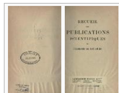
Собрание сочинений Соссюра