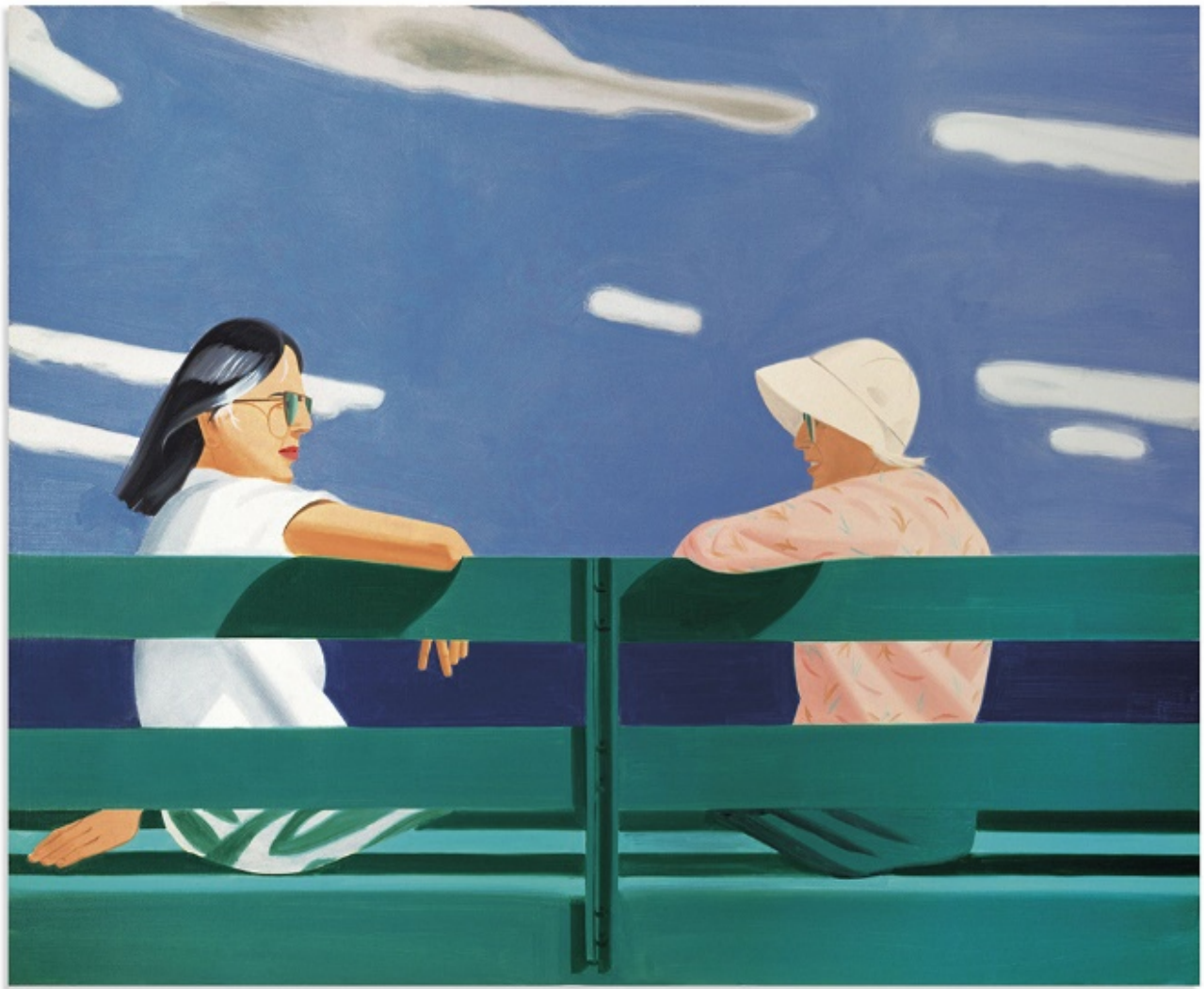
Рисунок 5. Рисунок 6.