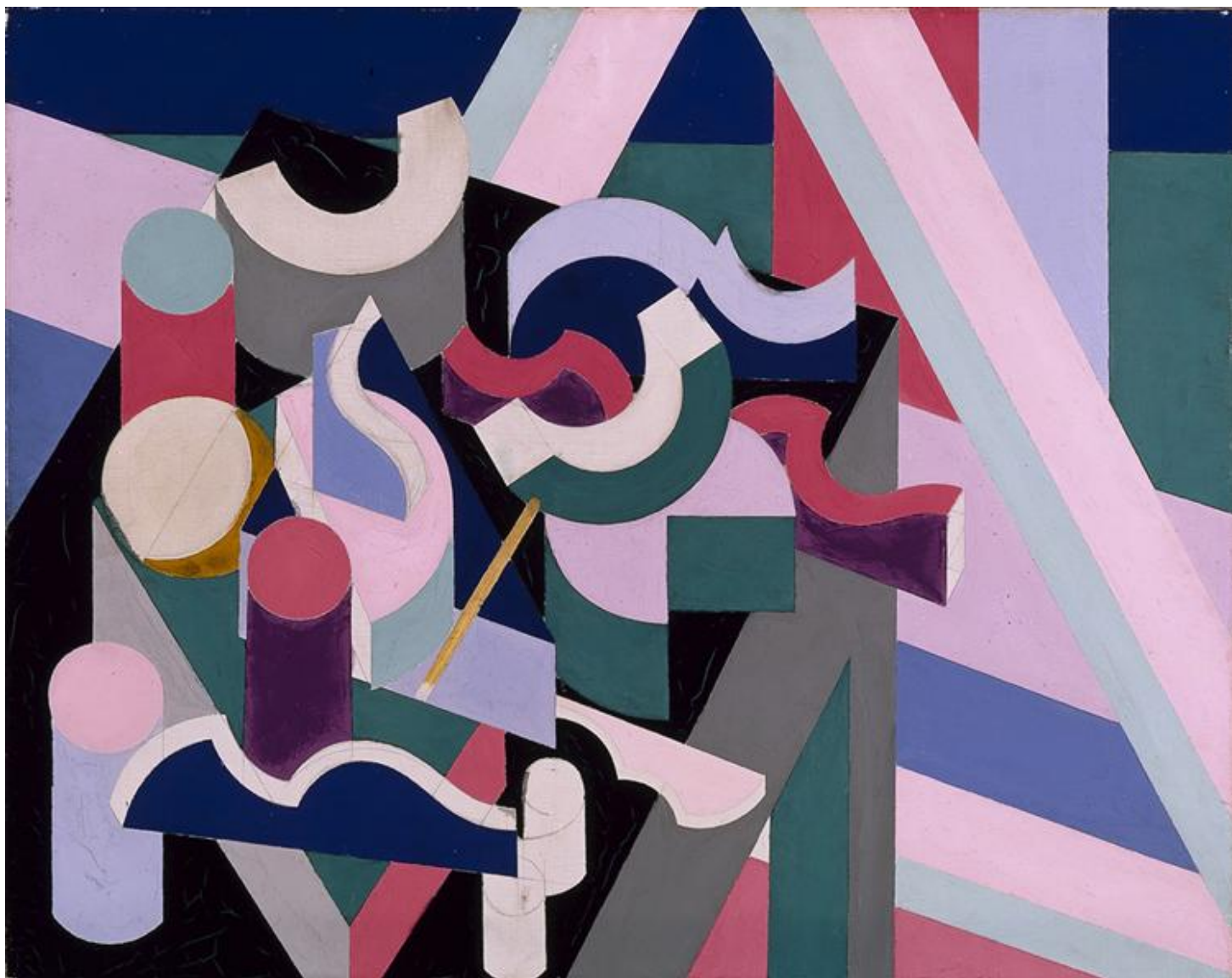
Рисунок 1. Рисунок 2.