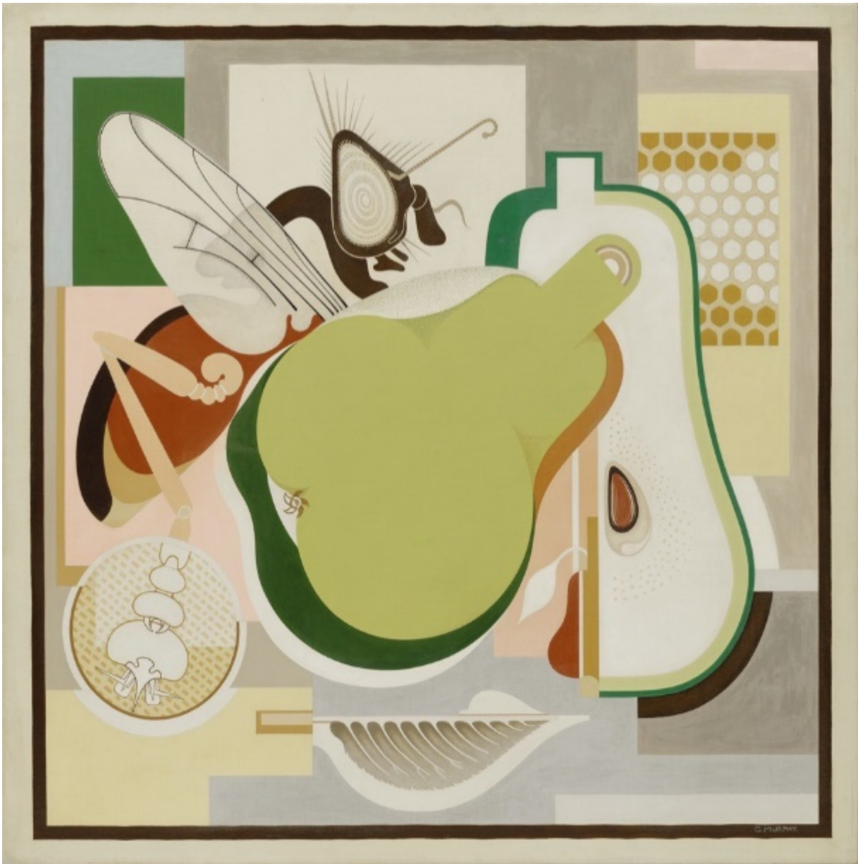
Рисунок 3. Рисунок 4.