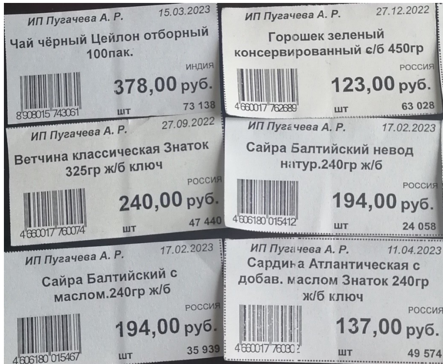
Рисунок 3 – Оформленные ценники на товары