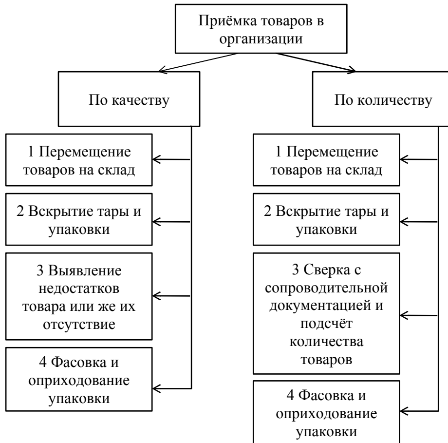
Рисунок 2 – Технологическая схема приёмки товара по количеству и качеству в торговой организации