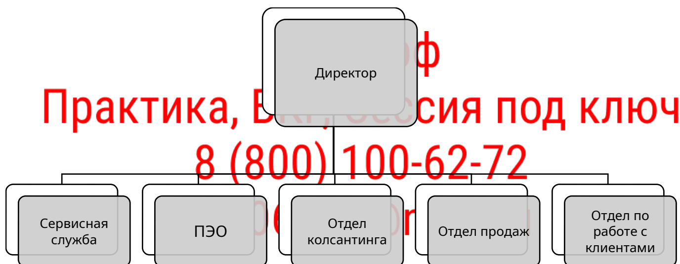
Рисунок 1 - Организационная структура ООО «ПК ВентКомплекс»

Организационная структура предприятия представлена на рисунке 1.