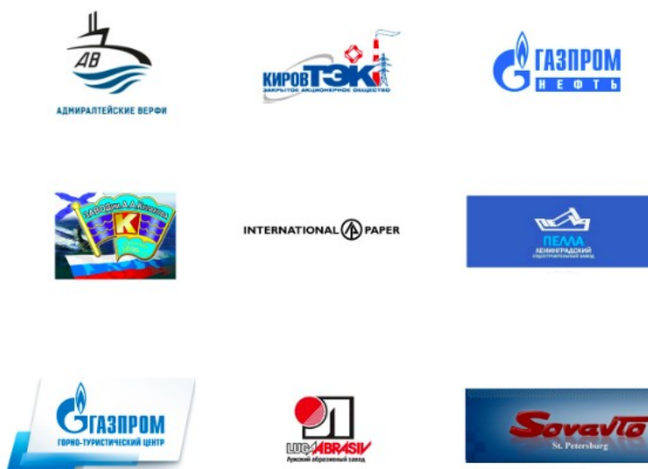
Рисунок 4 - Клиенты ООО ПК «ВентКомплекс»

Клиенты ООО ПК «ВентКомплекс» приведены на рисунке 4.