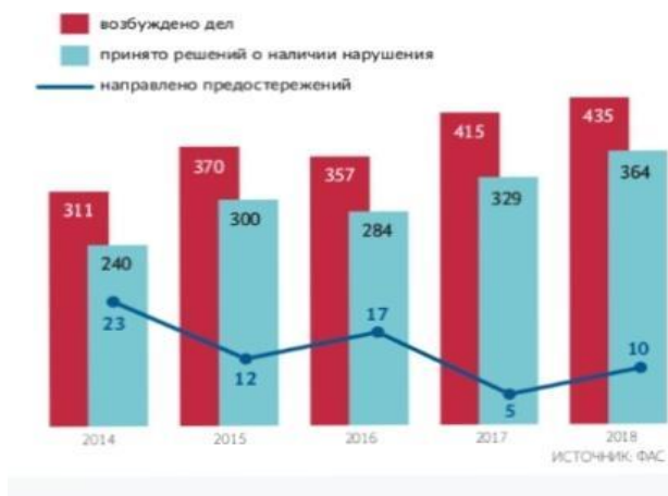
Рисунок 2 – Динамика числа уголовных дел по картелизации

две компании, заключившие картельное соглашение и принявшие участие в 400 аукционах на поставку медикаментов.