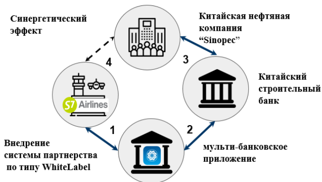
Рисунок 2 – Семантическая сеть цифровых каналов (на примере АЭБ)

банк, осуществляющий свою деятельность преимущественно на территории ДВФО [2].