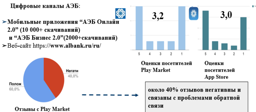
Рисунок 1 – Анализ существующих цифровых каналов АКБ «Алмазэргиэнбанк»