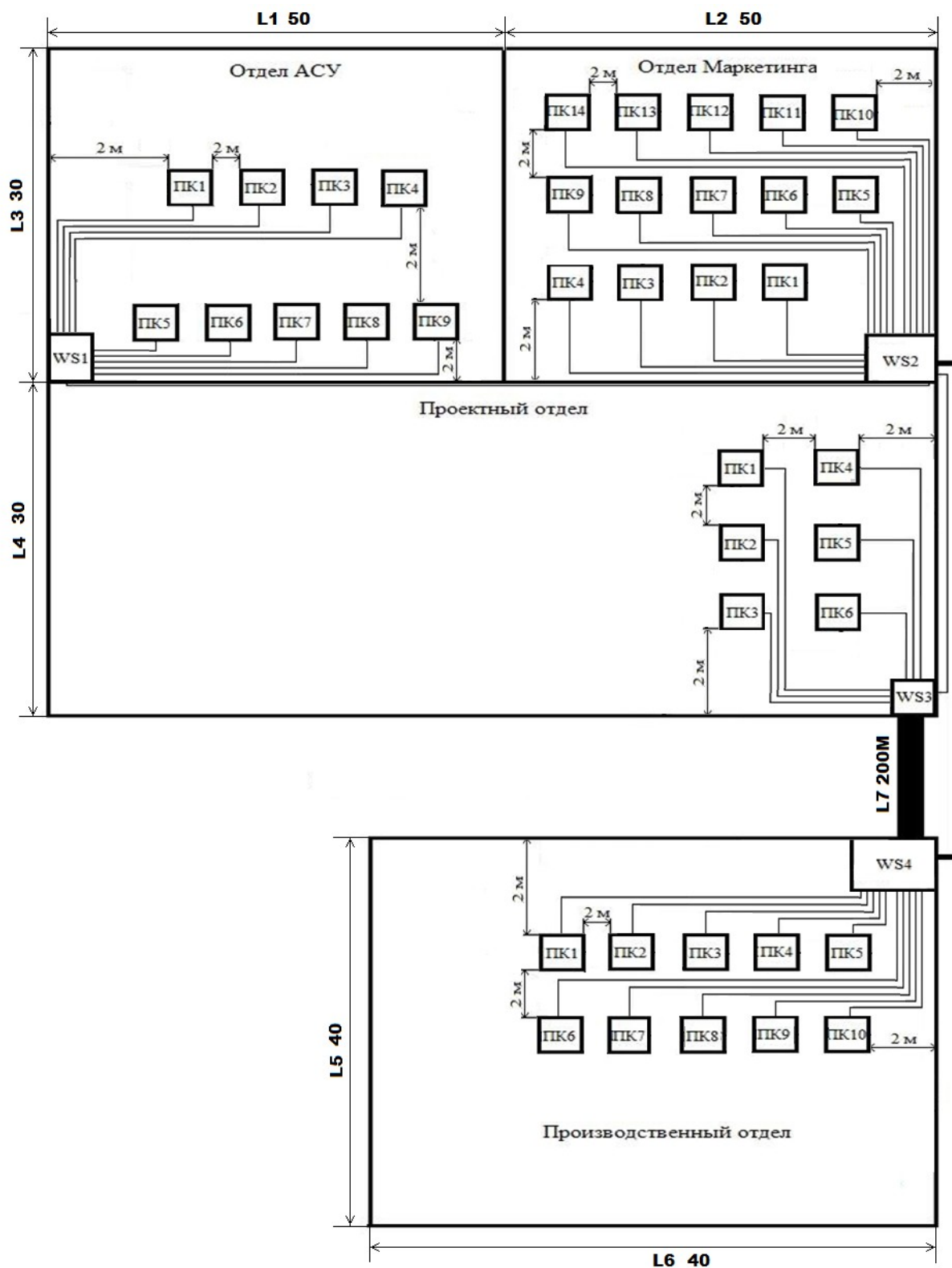
Рисунок А - План размещения оборудования и кабельных прокладок

WS - коммутационный шкаф; — оптоволокно; - неэкранированная витая пара