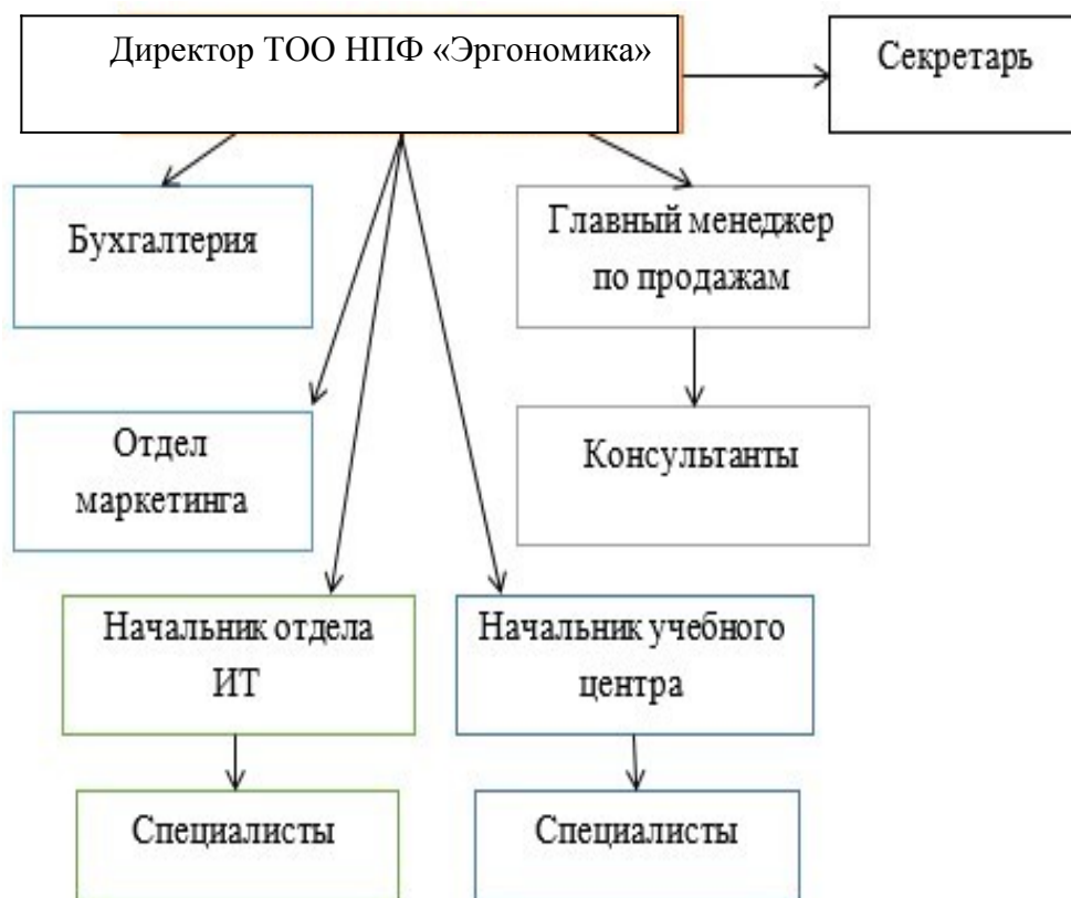
Схема 1 – Технологическая схема структуры организации