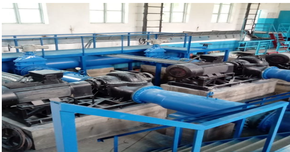
Рисунок 1.2 – Водоканалы в насосном оборудовании

- централизованное управление всем комплексом находящегося в эксплуатации водоканала насосного парка пакетом программного обеспечения, способного адаптироваться к изменяющейся структуре сетей.