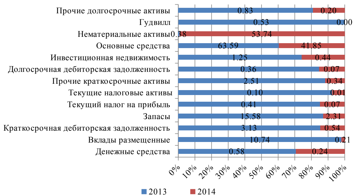
Рисунок 2 – Динамика удельного веса направлений использования финансовых ресурсов ТОО «Алма-ТВ» (% к итогу валюты баланса)

Прочие долгосрочные активы организации включают незавершенное строительство. В середине 2014 года было завершено финансирование строительства магистральной волоконно-оптической линии на участке Алматы-Хоргос. Краткосрочные активы состоят в основном из авансов, выданных под поставку ТМЗ и выполнение работ. В 2014 году они были уменьшены за счет создания резерва по сомнительным требованиям. Инвестиционная недвижимость и основные средства были переоценены в 2014 году. Обесценение гудвилла, возникшего при приобретении ТОО «Шымкент онлайн», связано с тем, что на момент формирования отчетности было вынесено решение приостановить деятельность данной организации на 5 лет. В связи с чем гудвилл был обесценен.