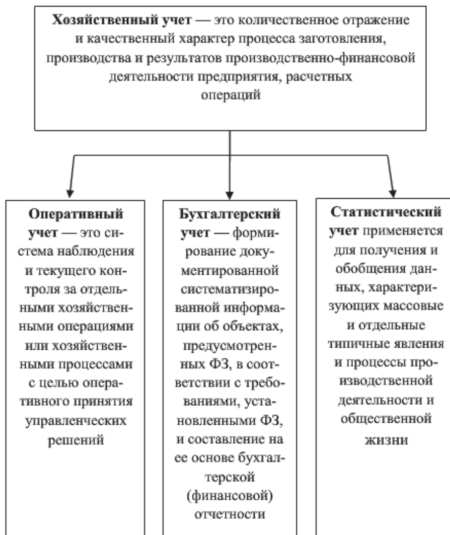
Рисунок 3. Понятие и виды хозяйственного учета 23