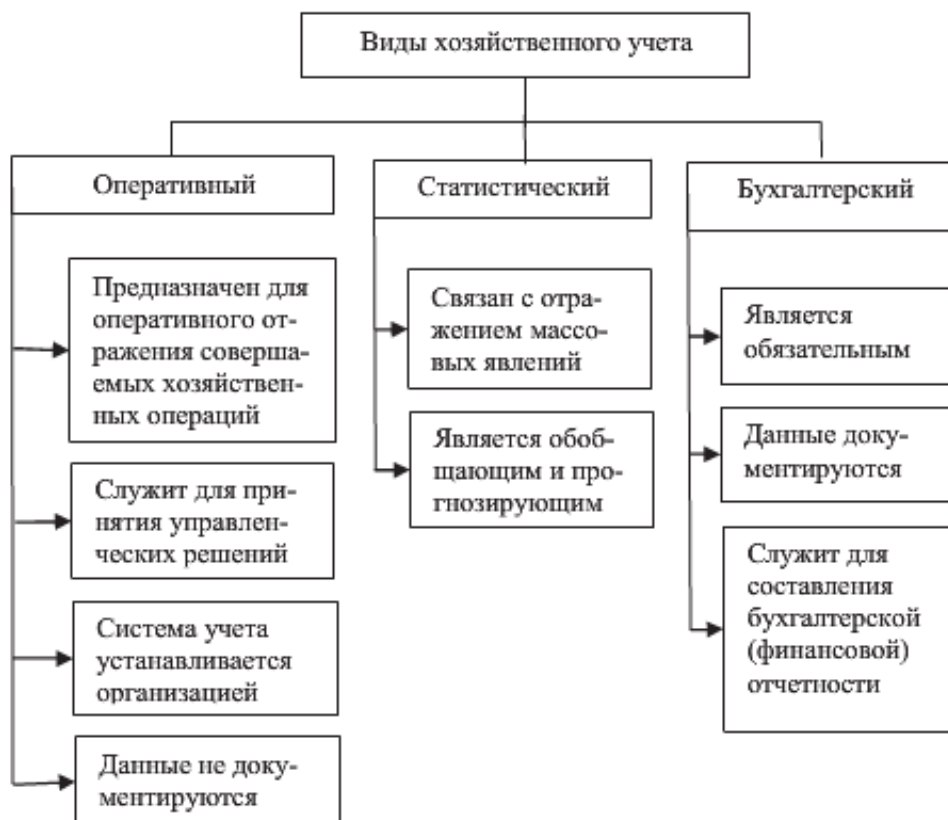
Рисунок 4. Характеристика видов хозяйственного учета 24

Главной формой бухгалтерского учета является бухгалтерский баланс. Бухгалтерский баланс показывает финансовое положение организации на установленную дату и отражает ресурсы организации в единой денежной оценке с одной стороны по их составу и направлениям использования – актив, а с другой - по источникам их финансирования (пассив).