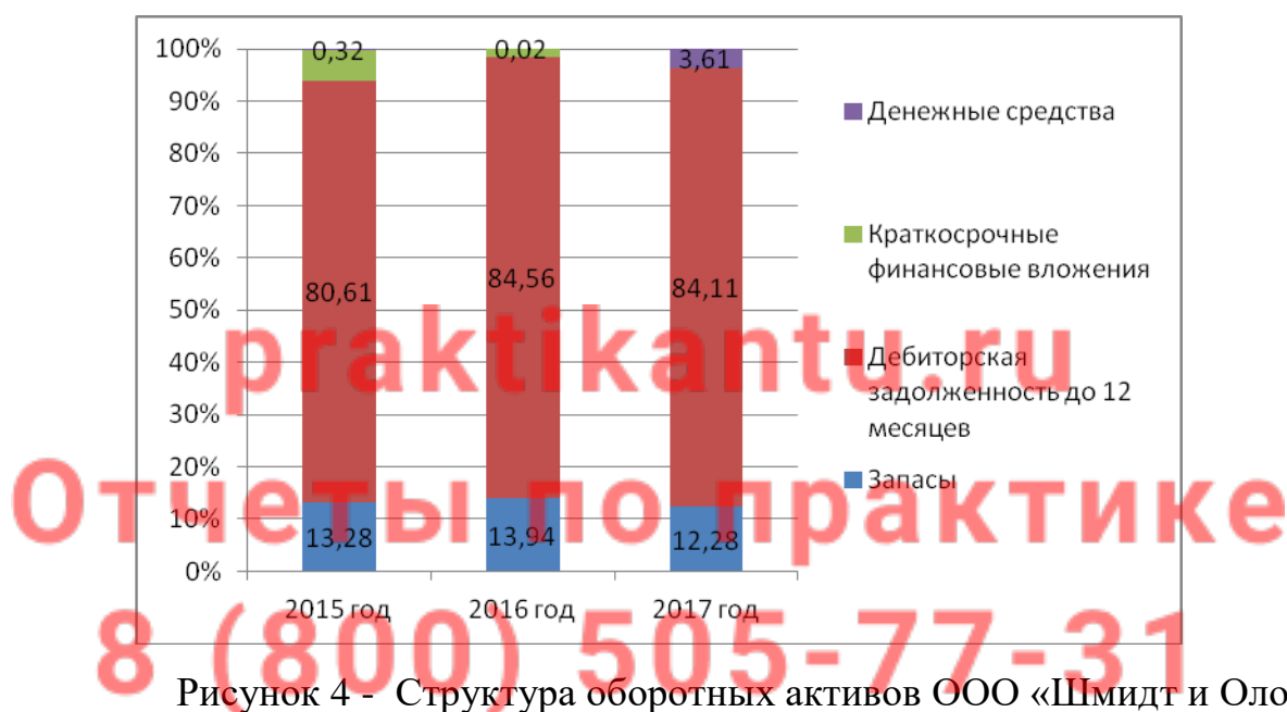
Рисунок 4 - Структура оборотных активов ООО «Шмидт и Олофсон, Марин» за 2015-2017 годы, %

Структура оборотных активов предприятия приведена на рисунке 4.