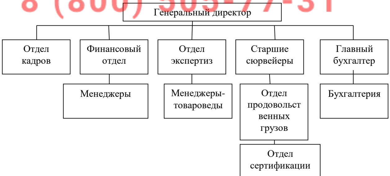
Рисунок 1 - Организационная структура ООО «Шмидт и Олофсон, Марин»

Рассмотрим организационную структуру ООО «Шмидт и Олофсон, Марин» (рисунок 1).