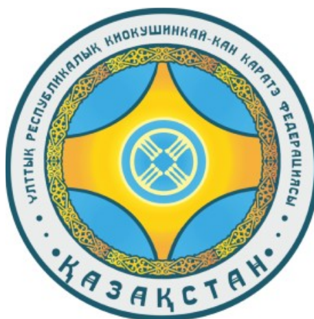
Рисунок 1 – Обозначение логотипа Республиканской Национальной Федерации Киокушинкай-кан каратэ (РНФКК)

На рисунке 1 представлен логотип предприятия.