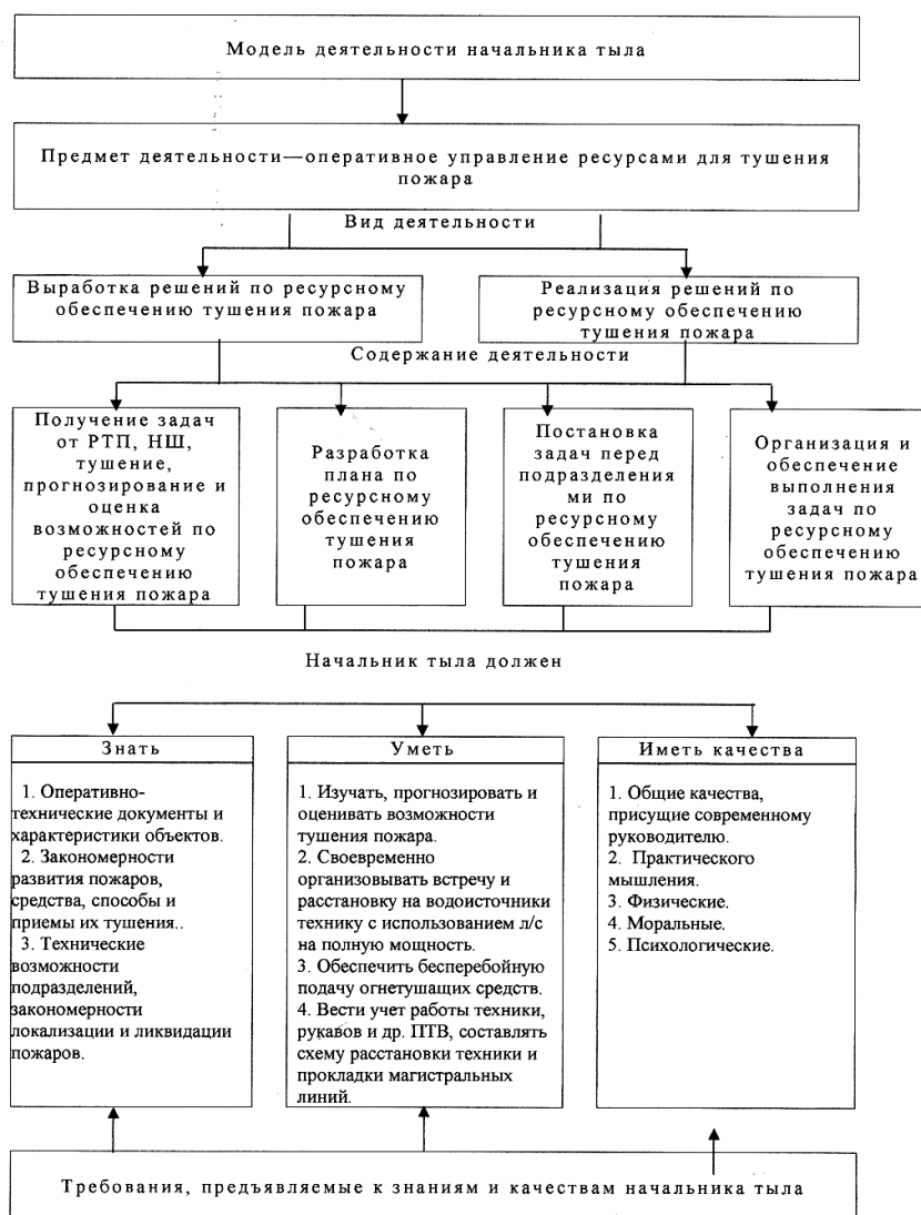
Рис. 16. 3. Модель деятельности начальника тыла на пожаре

В состав оперативного штаба пожаротушения также включается ответственный за правила охраны труда и технику безопасности, назначаемый из числа руководящего состава гарнизона. Он подчиняется РТП и начальнику оперативного штаба. В его обязанности входит контроль соблюдения личным составом правил охраны труда при проведении спасательных работ, при работе на высотах, при работе в составе звеньев ГДЗС, а также напоминание этих правил участникам тушения пожара.