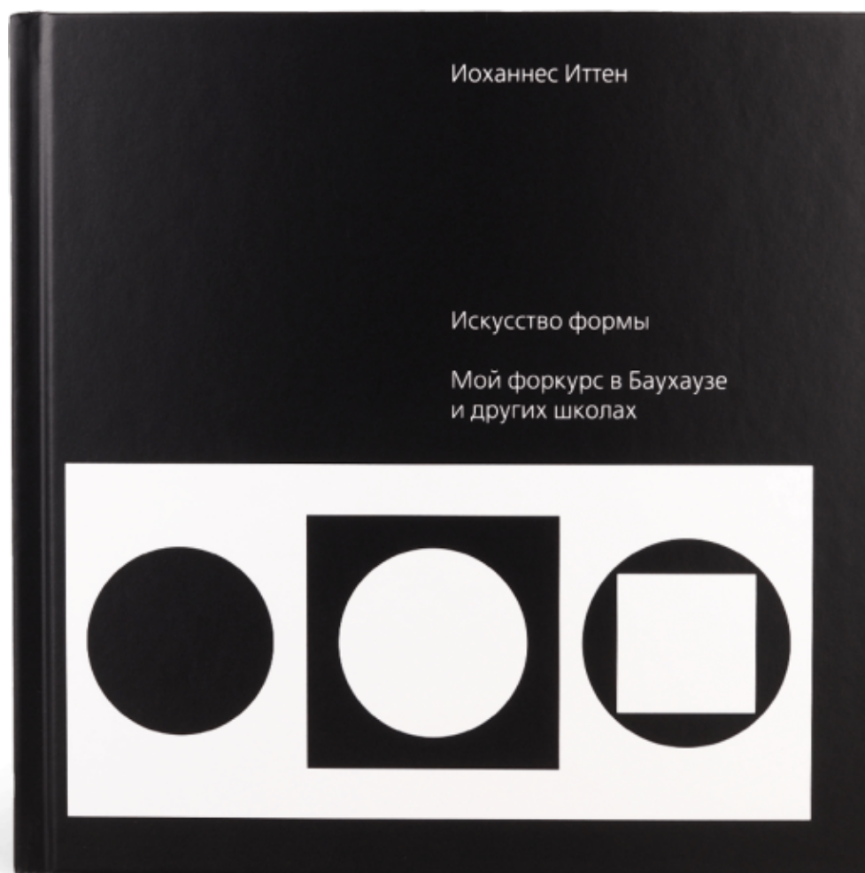
Рисунок 4. Рисунок 5.