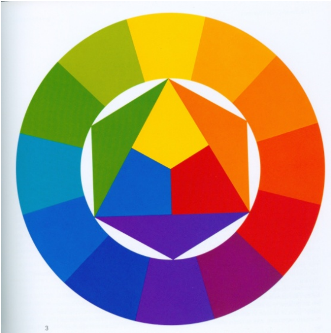
Рисунок 6. Рисунок 7.