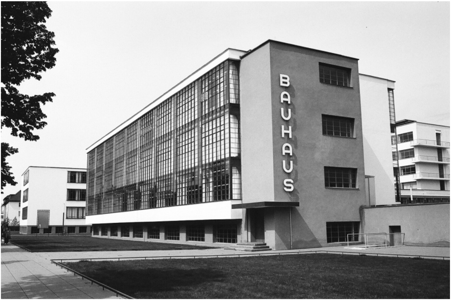
Рисунок Рисунок .