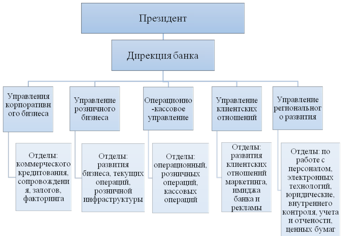
Рисунок 1 – Организационная структура АО "Отп Банк"

Организационная структура банка представлена на рисунке 1.