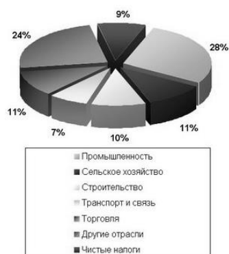
Рис. 2.4. Отраслевая структура ВРП

Таблицы применяют для повышения наглядности, удобства сравнения каких-либо показателей и систематизации материала.