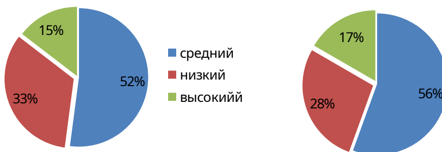
Рисунок 2 – Сравнительный анализ полученных в результате опытно – экспериментальной работы данных

Теперь можно сравнить полученные результаты (рисунок 2).