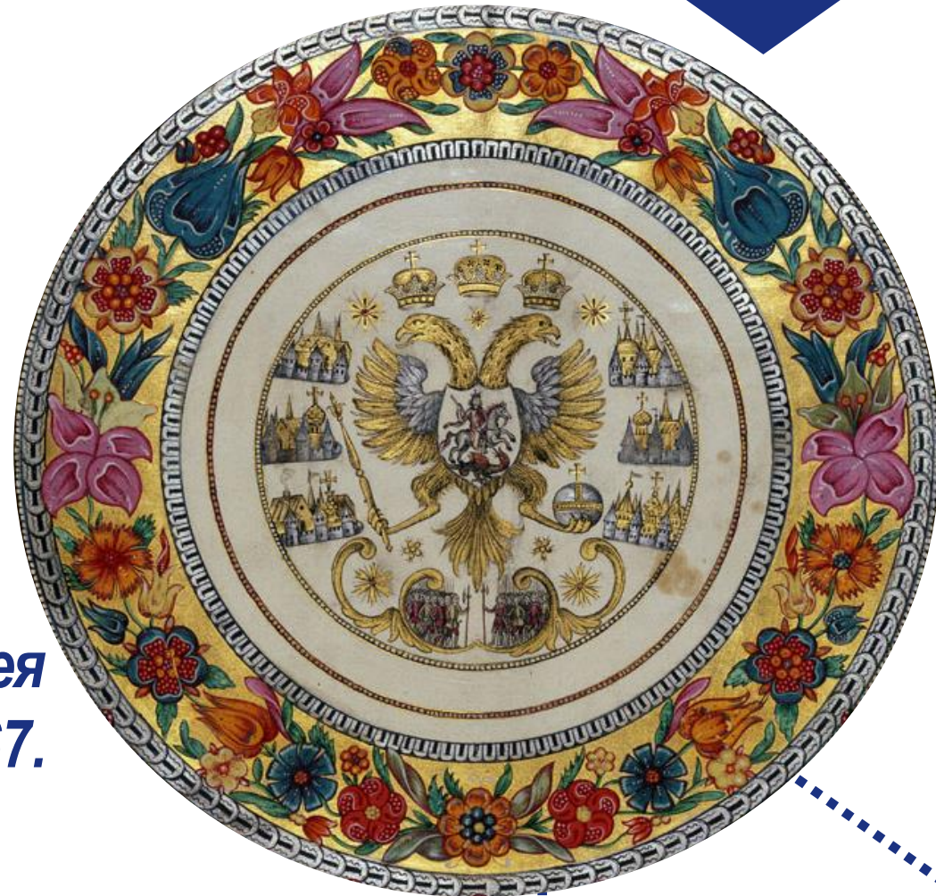
Рисунок печати Алексея Михайловича, 1667.

Анализ текста позволит подвести учащихся к важному выводу - герб был истолкован как знак, равно принадлежащий двум нераздельным в понимании составителей описания ипостасям: самому царю и «Его Царского Величества Российского Царствия», то есть стране.