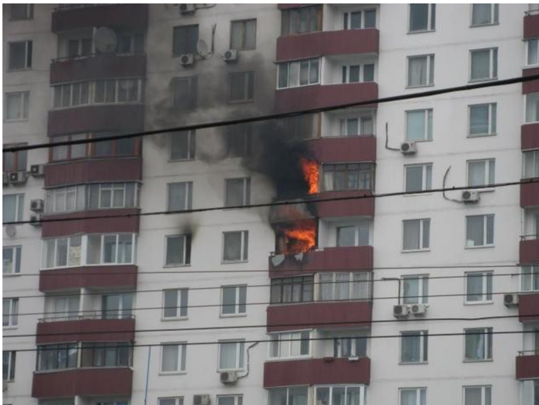
(рис.4 пожар в многоэтажном жилом доме.)

Основная причина пожаров в жилых домах — нарушение самых элементарных правил пожарной безопасности или иначе говоря, халатность или небрежность, поэтому давайте, ребята, познакомимся с противопожарным режимом в жилом доме.