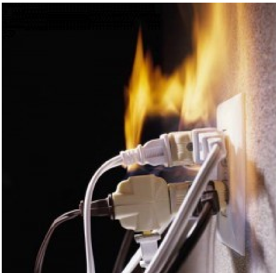
(рис.2 возгорание электропроводки.)

Изоляция электропроводки может загореться и от так называемой перегрузки, когда в сеть одновременно включается несколько электропотребителей без расчета сечения проводов.