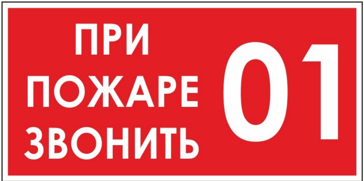
(рис.6 номер пожарной охраны.)

Сообщение о пожаре надо передавать спокойно, говорить четко, не торопясь. Очень важно правильно назвать улицу, номер дома. Если номер дома не известен, следует назвать какой-нибудь примечательный ориентир (около кинотеатра; в доме, где столовая). Затем в двух—трех словах сказать, что горит, и назвать свою фамилию.