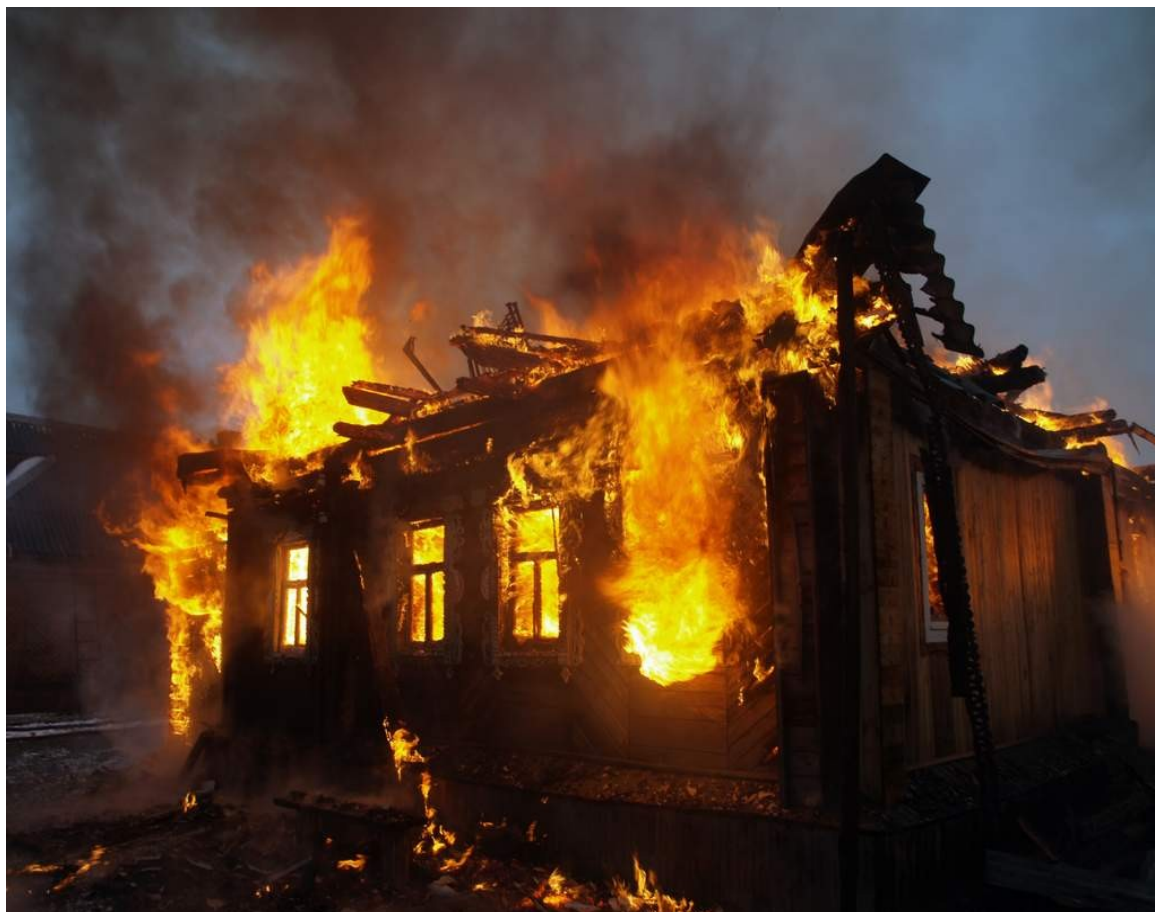
(рис.1 пожар в жилом доме.)

В столице Японии возникает до 50 пожаров в сутки. Много крупных пожаров происходит в городах Англии, США и других государствах. Особенно много пожаров возникает в слаборазвитых странах. Согласно официальным данным пожары наносят значительный материальный ущерб в миллиарды рублей, огонь уничтожает тысячи домов, без крова остаются тысячи жителей.