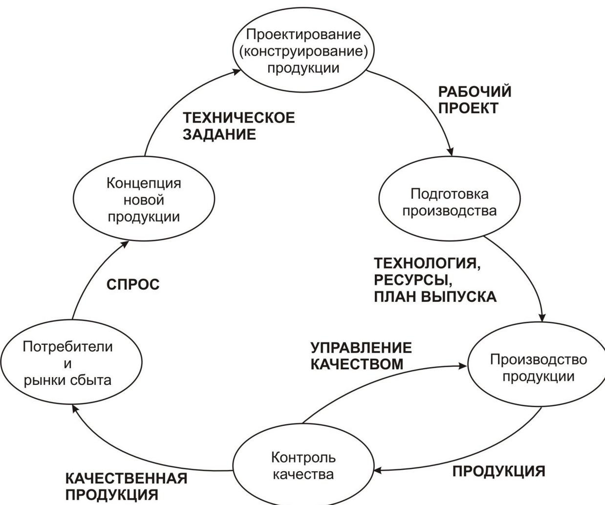
Рис. 1. Производственный цикл

Производство исходит из возникающей в обществе потребности в той или иной продукции и имеет целью удовлетворение этой