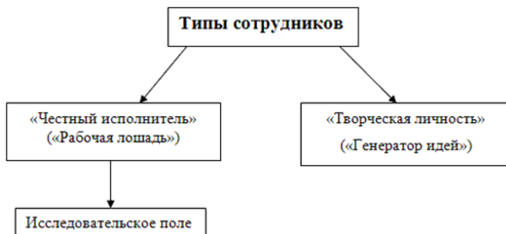
Рисунок 1- Типы сотрудников.

Что представляют собой каждый «чистый» тип. Можно судить уже из названия. Творческая личность капризна, у нее свой собственный рабочий ритм. Упряма, непредсказуема, своенравна. Ей ничего не стоит сломать рабочий процесс, аргументирую вопиющий факт фразой: «Что-то я сегодня не в духе». Она критически осмысливает действительность, в том числе и родное начальство. Добавьте сюда частые депрессии, ужасный характер, вечную погоню за персональной славой. В отличие от стабильного честного исполнителя «генератор идей» никогда не простит критики в свой адрес. На рисунке 1 представлена схема типов сотрудников.