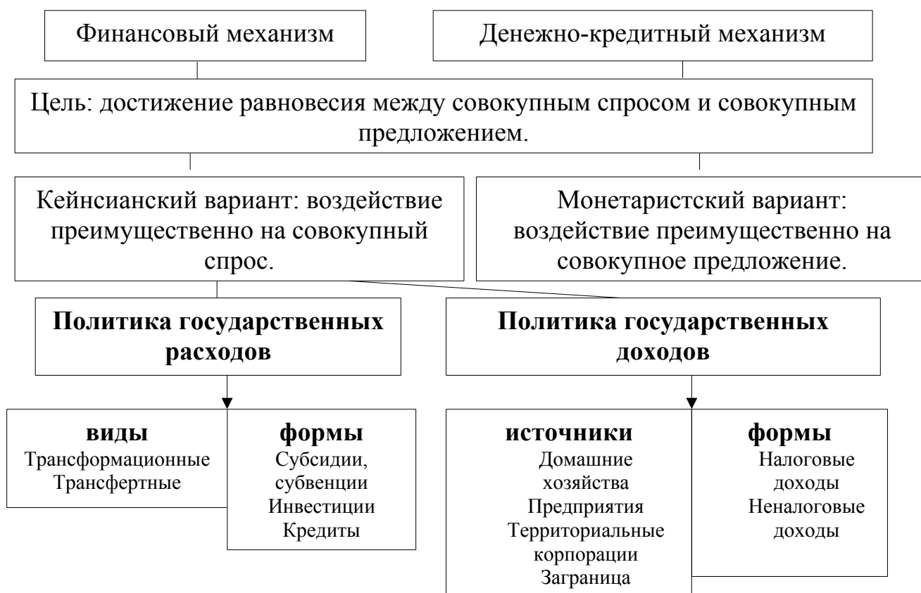
Рисунок 2 - Инструменты экономической политики

Государственное регулирование рыночной экономикой проводится по шести основным направлениям: