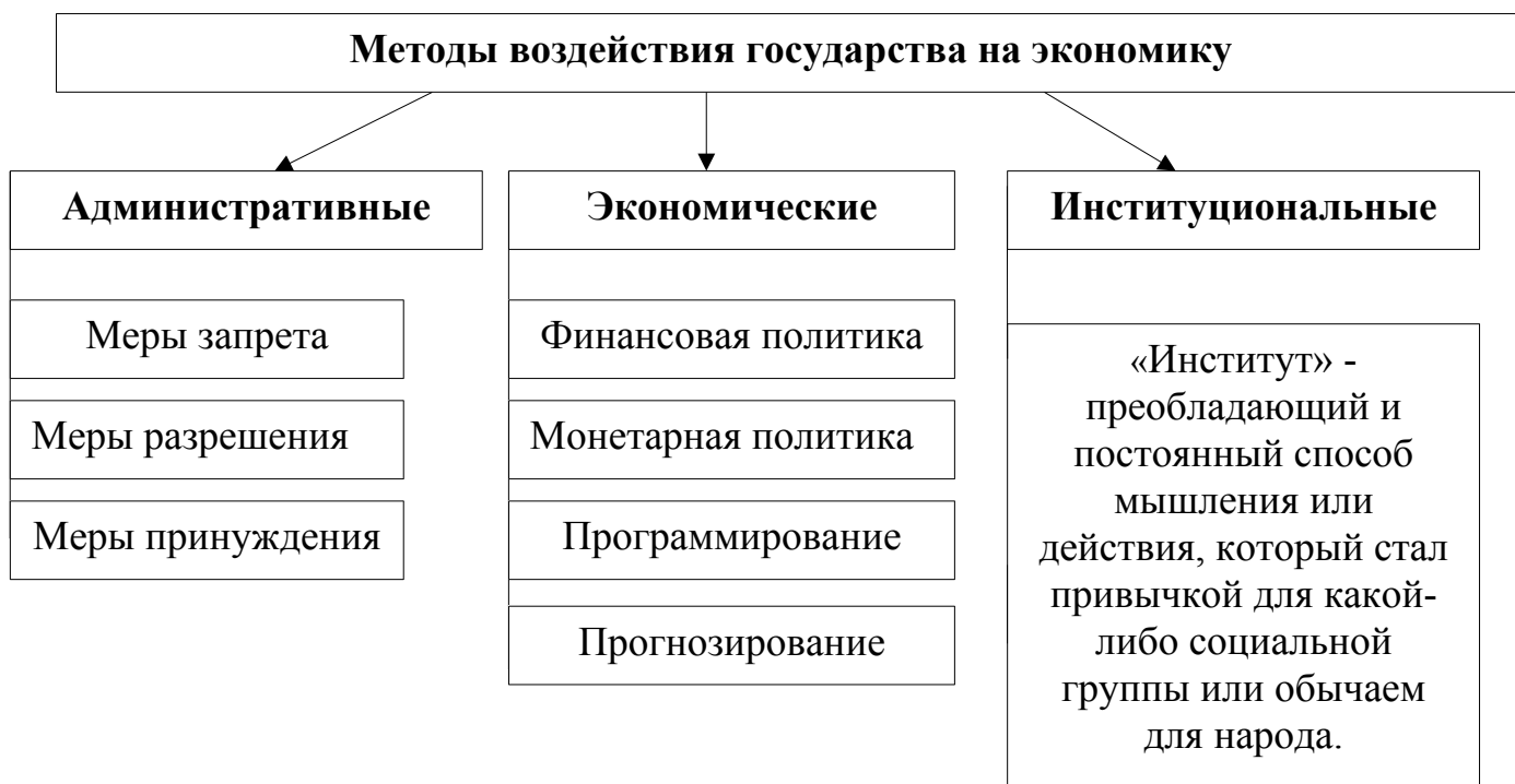
Рисунок 1-Методы воздействия на экономику

Обратимся к еще одной, весьма важной классификации методов воздействия на экономику. Критерий подхода – организационно-институциональный. Данный перечень включает: административные, экономические и институциональные методы (рисунок 1). 1