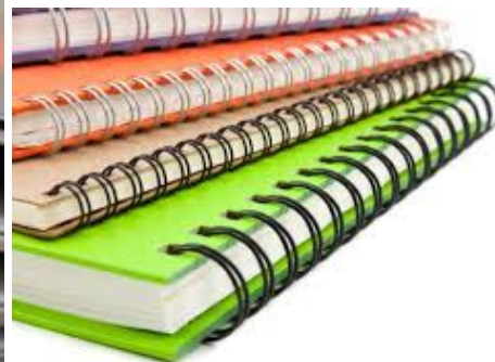
Рис. 8. Переплет пружиной