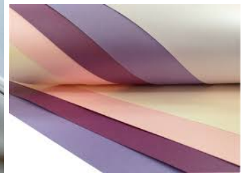
Рис. 1. Мелованная бумага