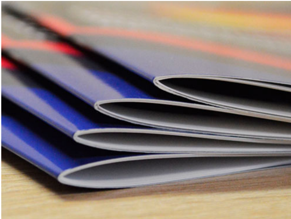
Рис. 7. Скрепление скобой

2. Переплет пружиной (рис. 9). Популярный экономичный способ скрепления изделий с разнообразной толщиной . Один из наиболее удобных и надежных способов переплести презентацию, диплом, любую документацию и многое другое.