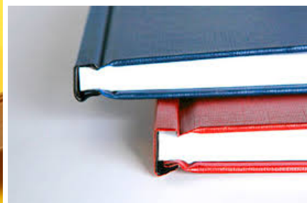
Рис. 5. Твердый переплет