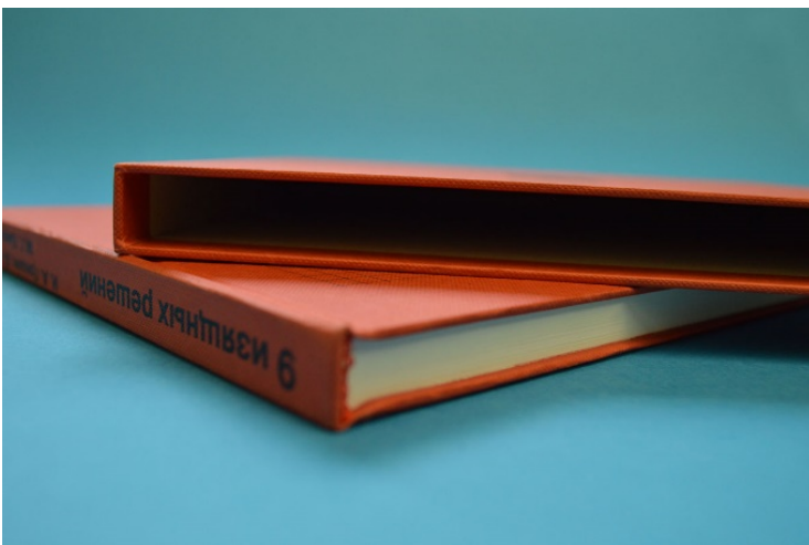
Рис. 6. Переплет 7Б

Форзац - сложенный пополам лист бумаги или оттиск (односгибная тетрадь), помещаемый между переплетной крышкой и блоком книги. Он выполняет декоративно-оформительскую функцию: скрыть «изнаночную» сторону переплетной крышки и место крепления последней с книжным блоком.