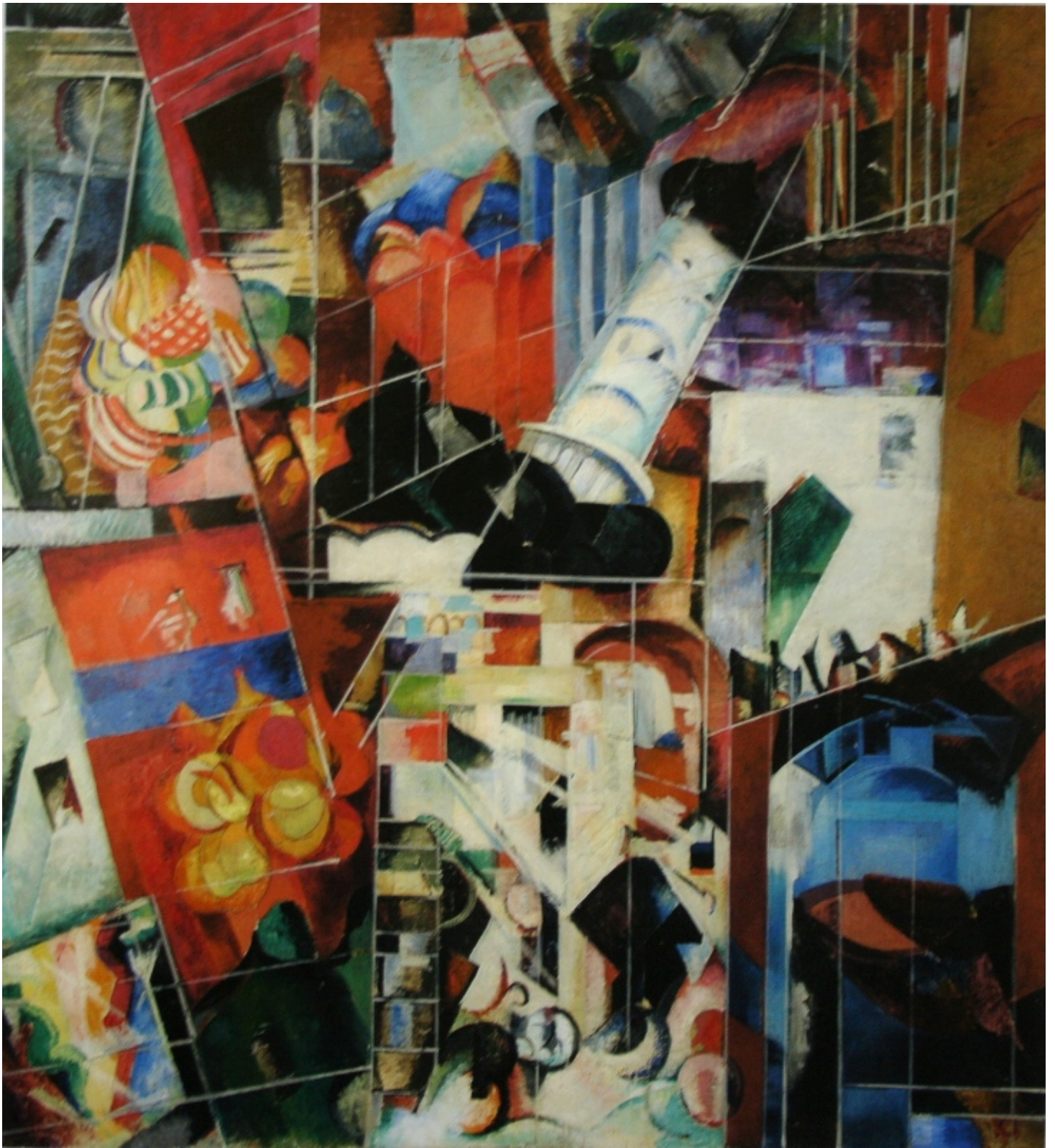
«Москва. Синтетический город.» Александра Экстер 1914 год