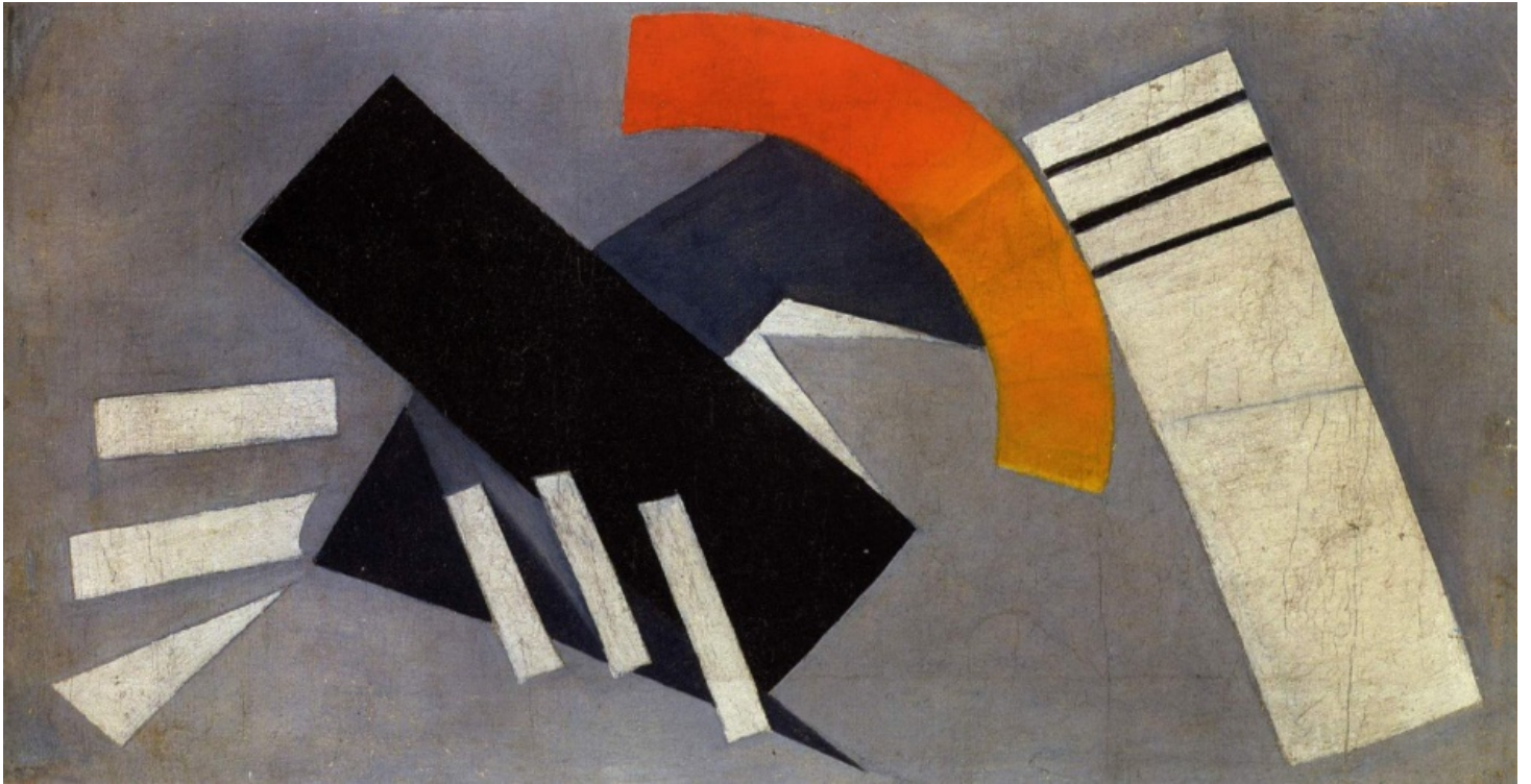
«Бессюжетная композиция на белом фоне» Ольга Розанова 1913 год