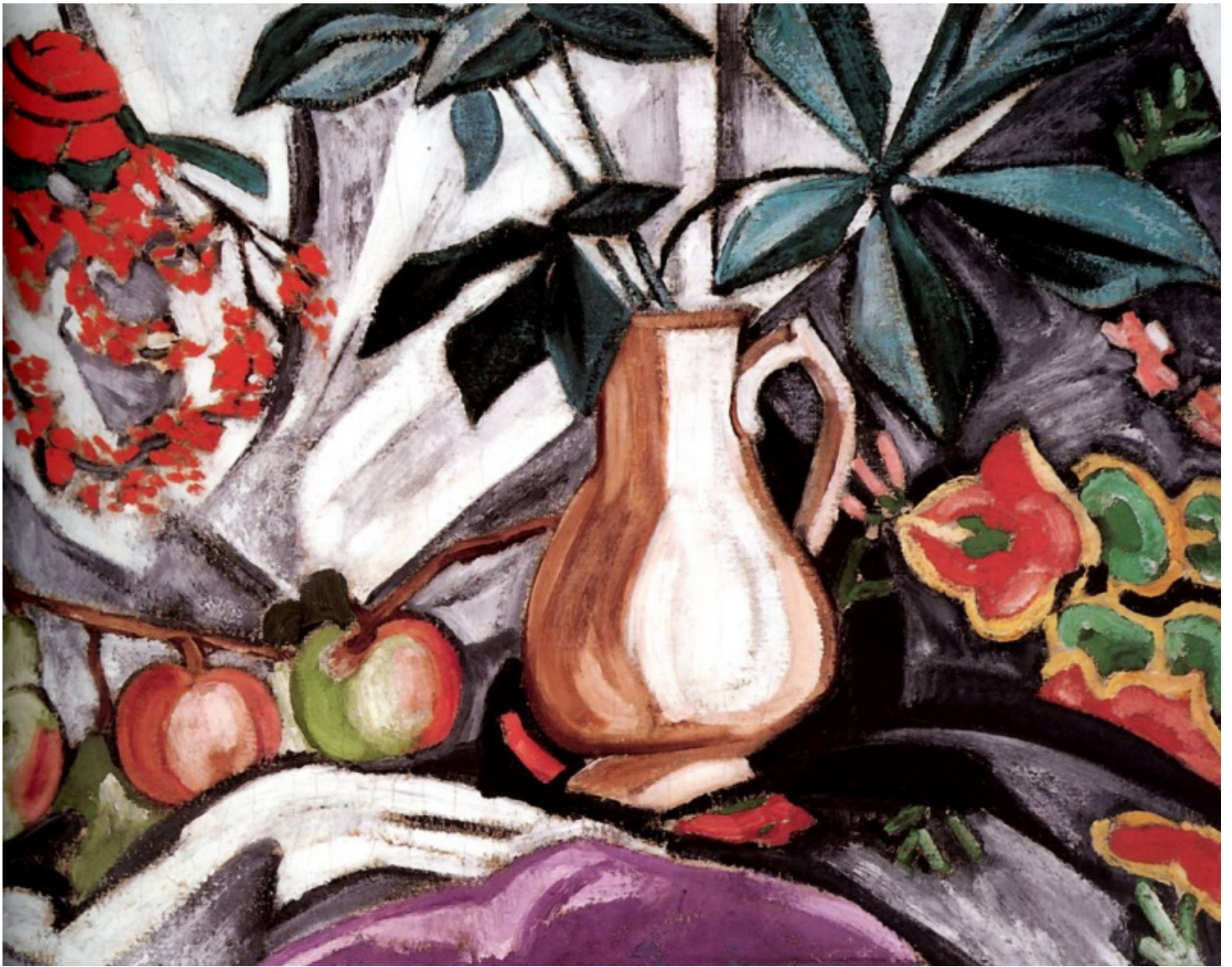
«Натюрморт с кувшином и яблоками» Ольга Розанова 1910 год