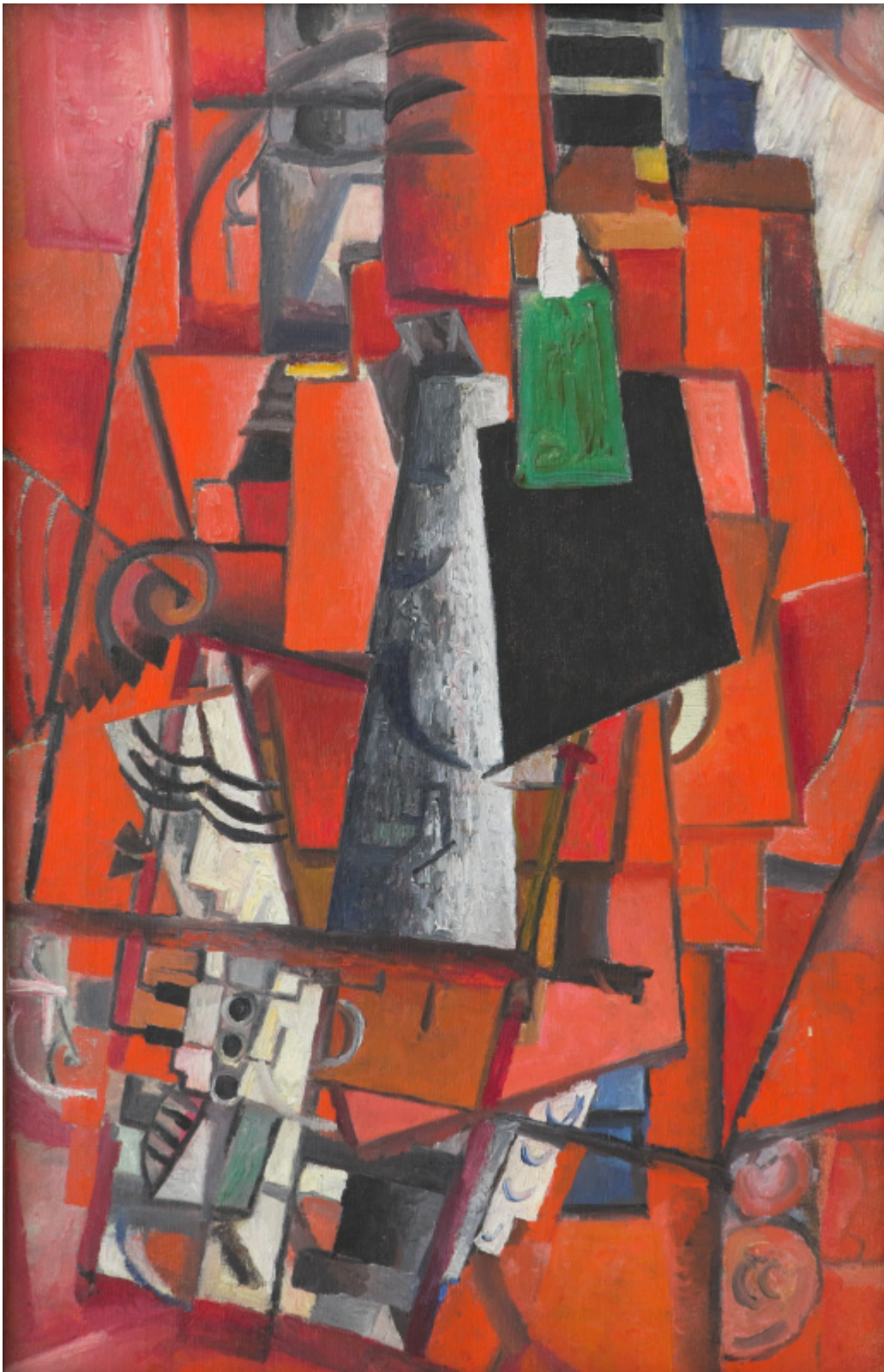
«Дама и Рояль» Казимир Малевич 1913 год