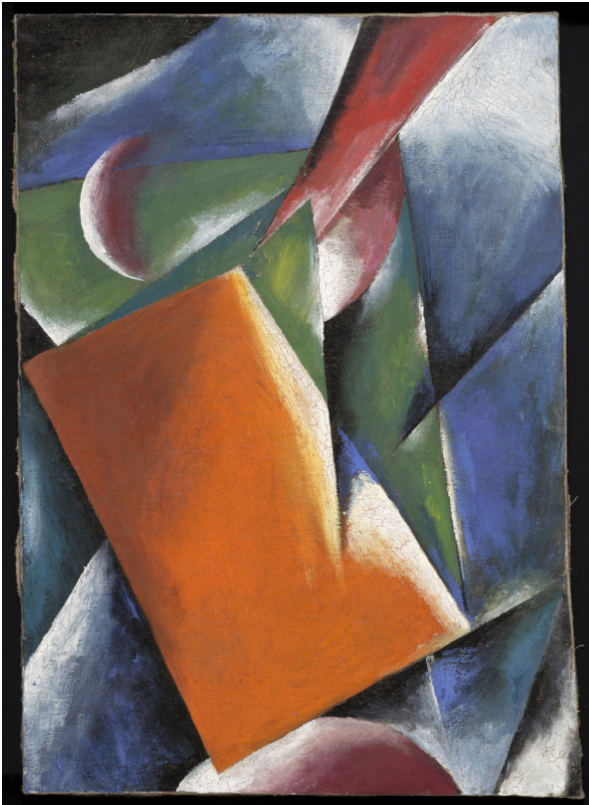
«Архитектоника Картины» Ольга Попова 1917 год