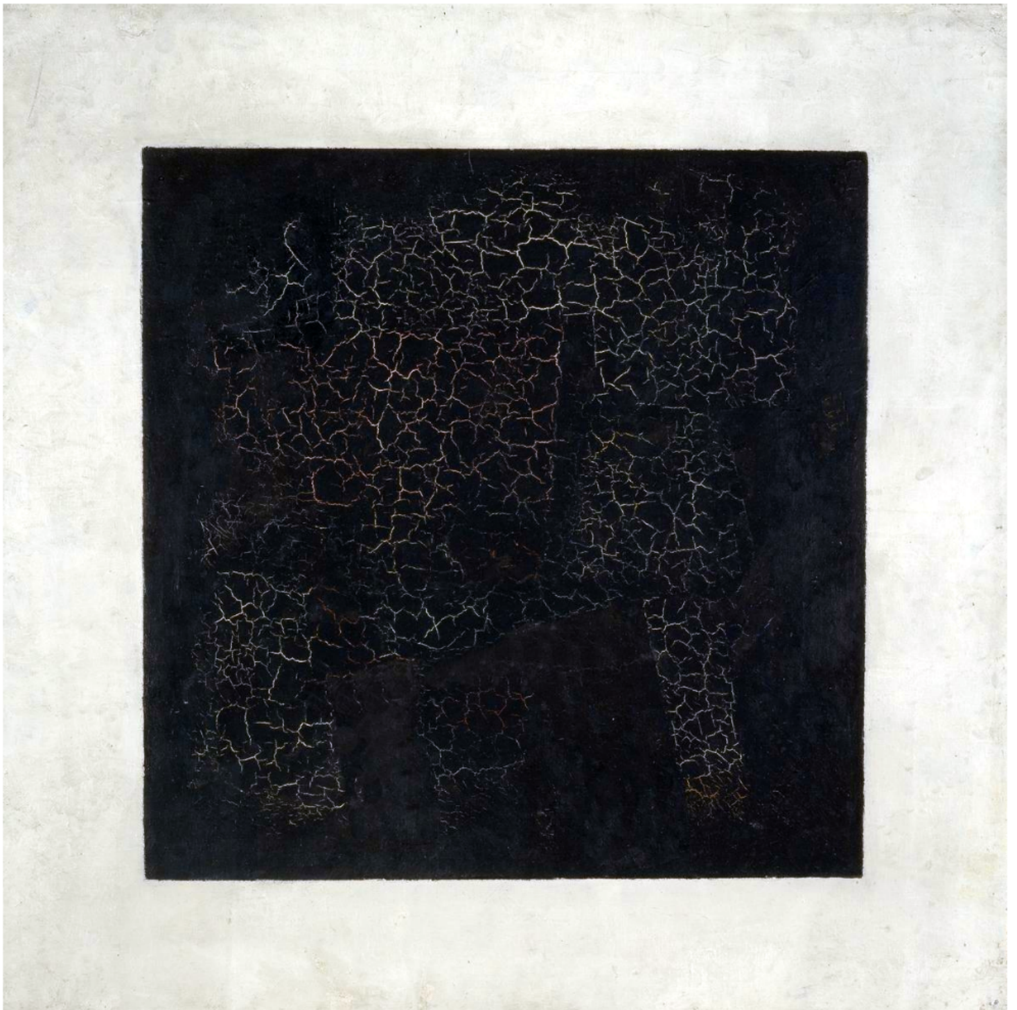
«Черный квадрат» Казимир Малевич 1915 год.