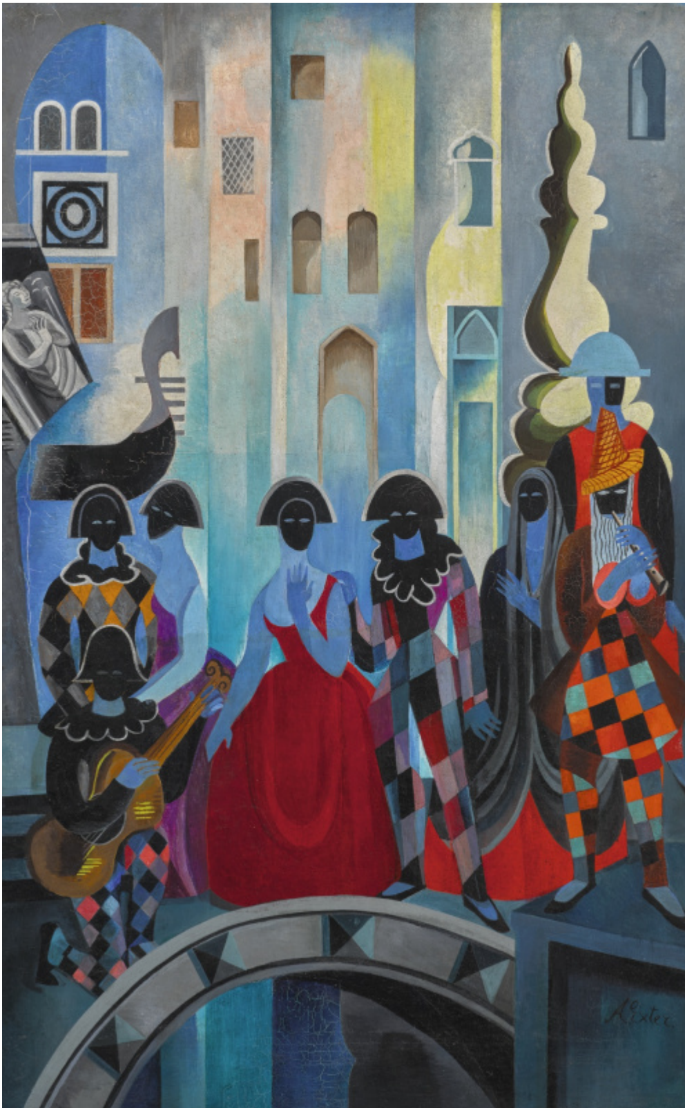
«Карнавал в Венеции» Александра Экстер