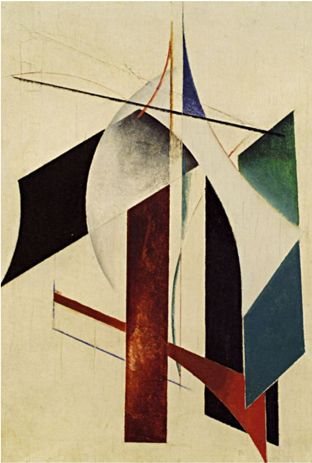
«Необъективная композиция» Александр Родченко 1917 год.