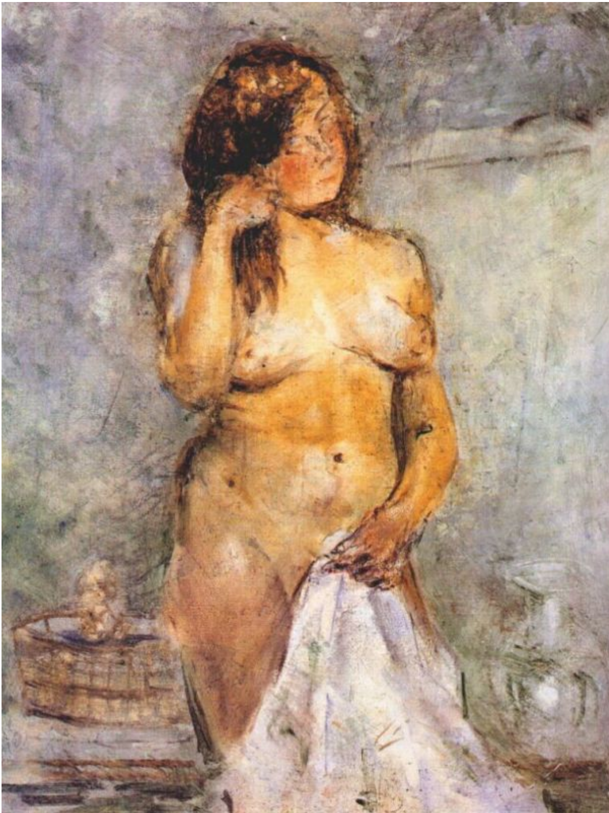
«Купание женщины» Владимир Татлин