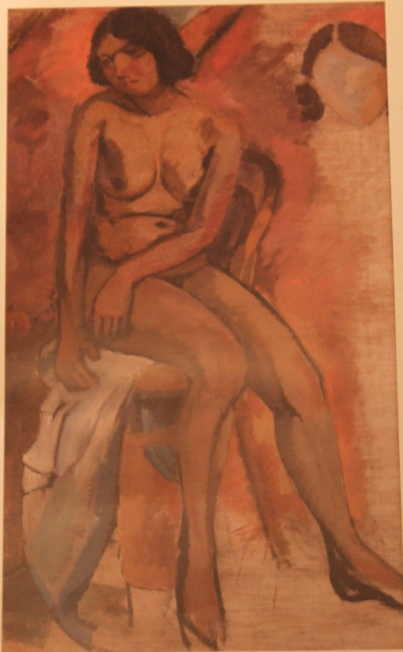
Любовь Попова (1889 – 1924) Натурщица. 1912. Холст, масло. 125 x 73