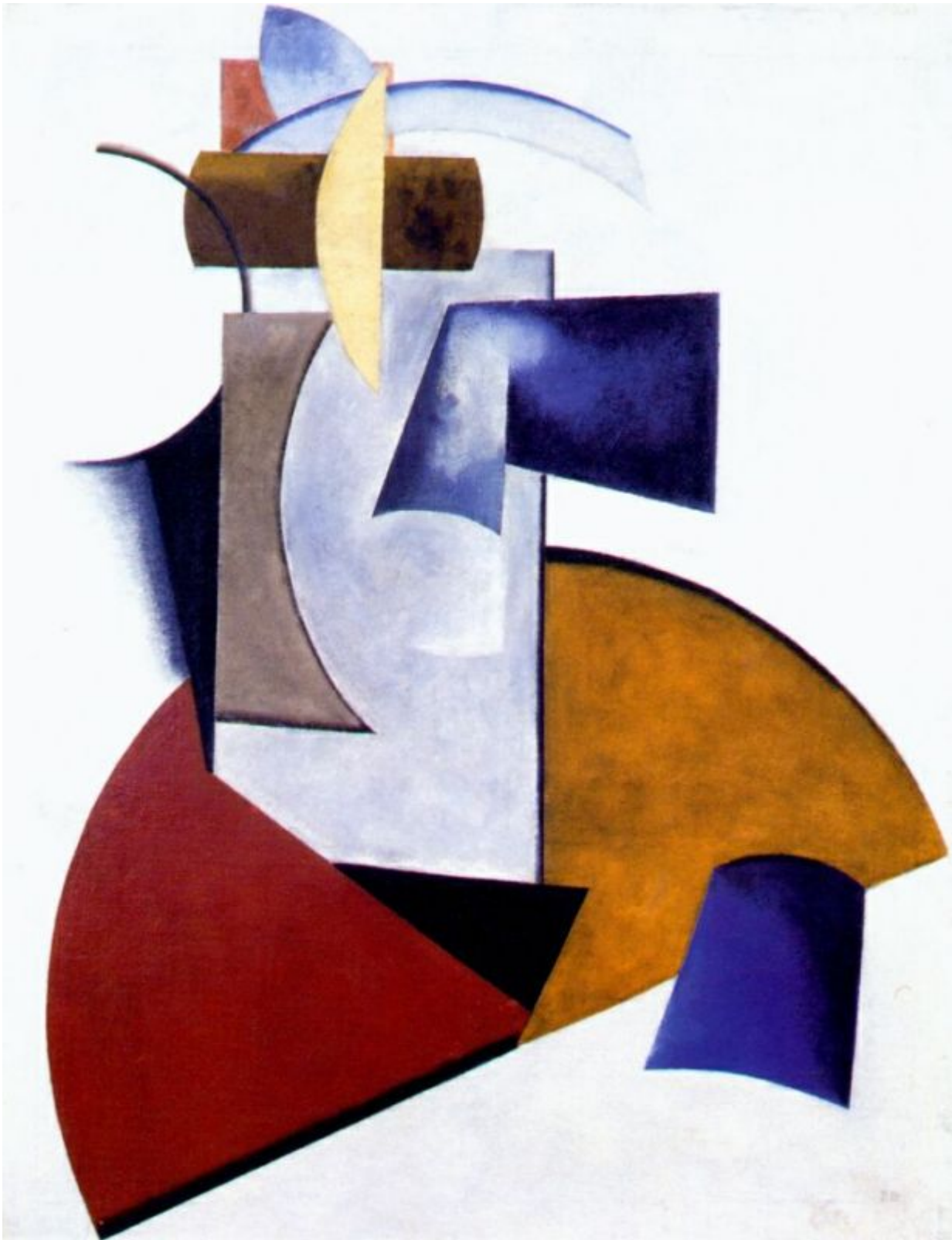
«Цель композиции» Александр Родченко