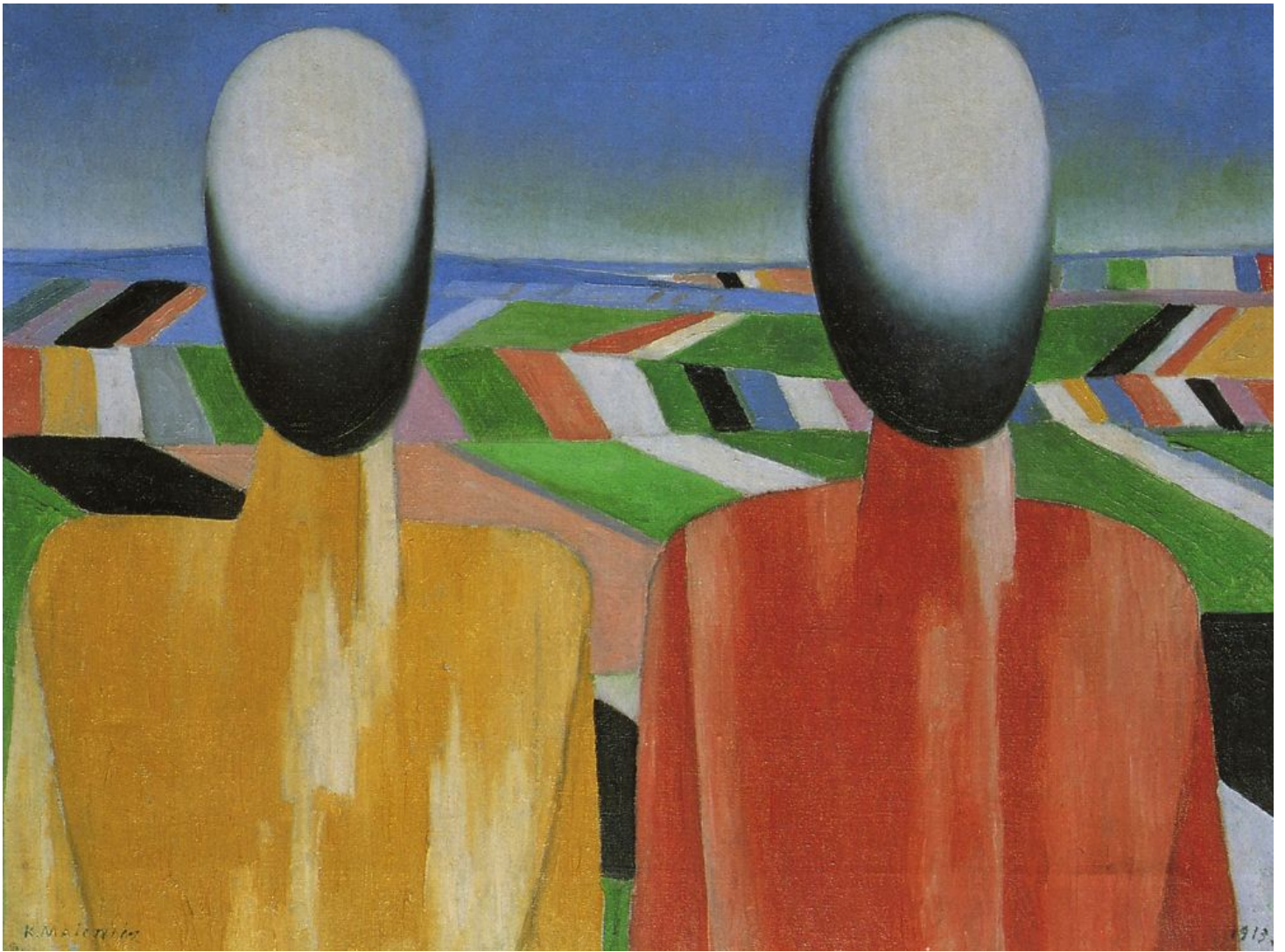
«Два крестьянина на фоне полей» Казимир Малевич 1930 год