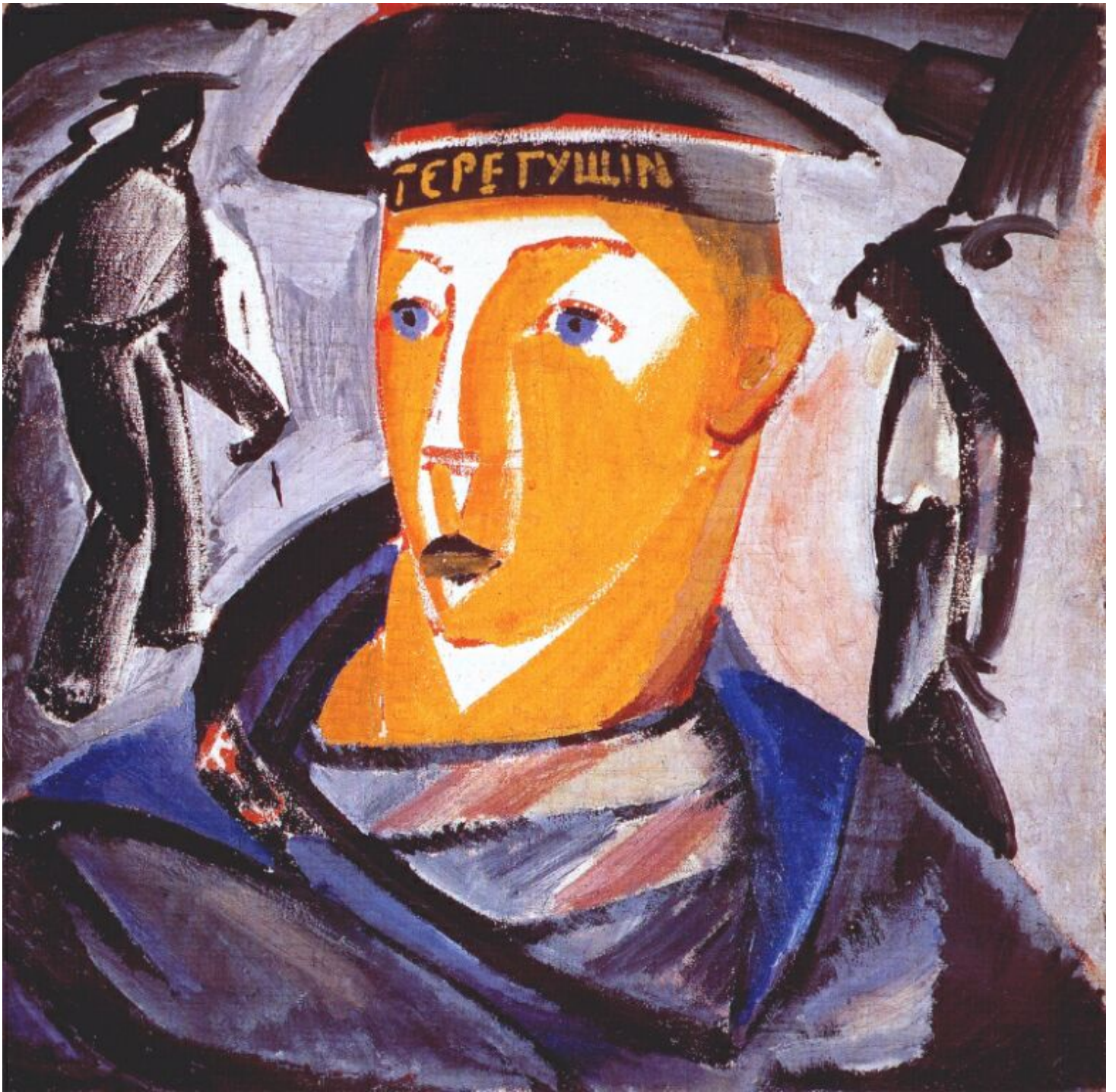
«Моряк» Владимир Татлин