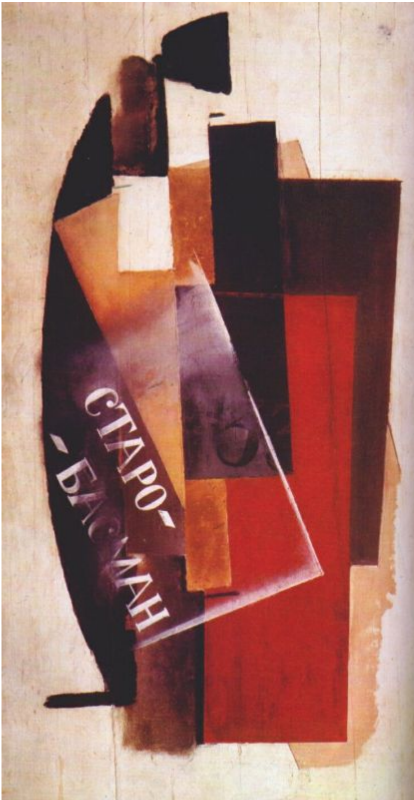
«Сюжет 1» Владимир Татлин