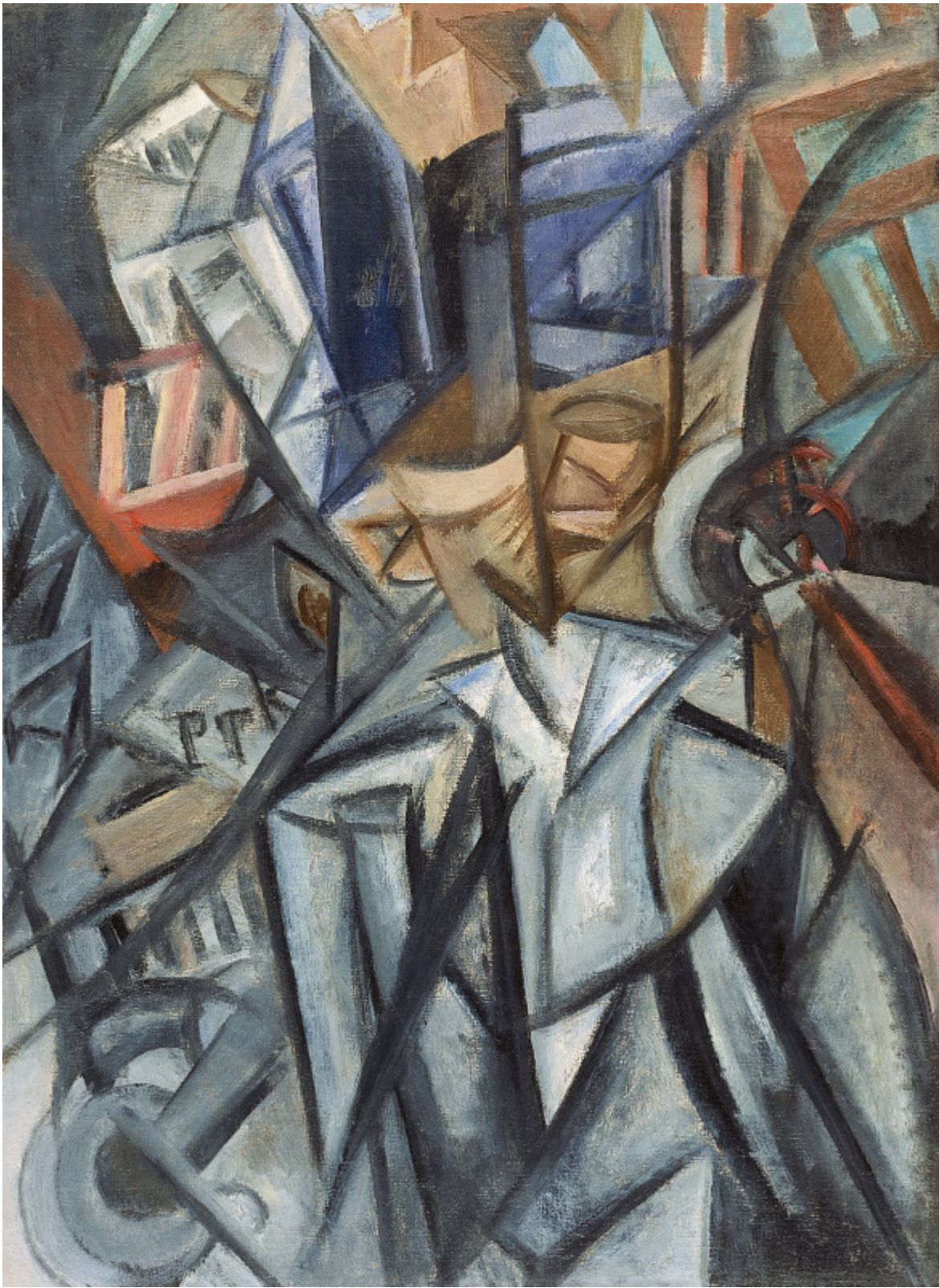
«Мужчина на улице» Ольга Розанова 1913 год