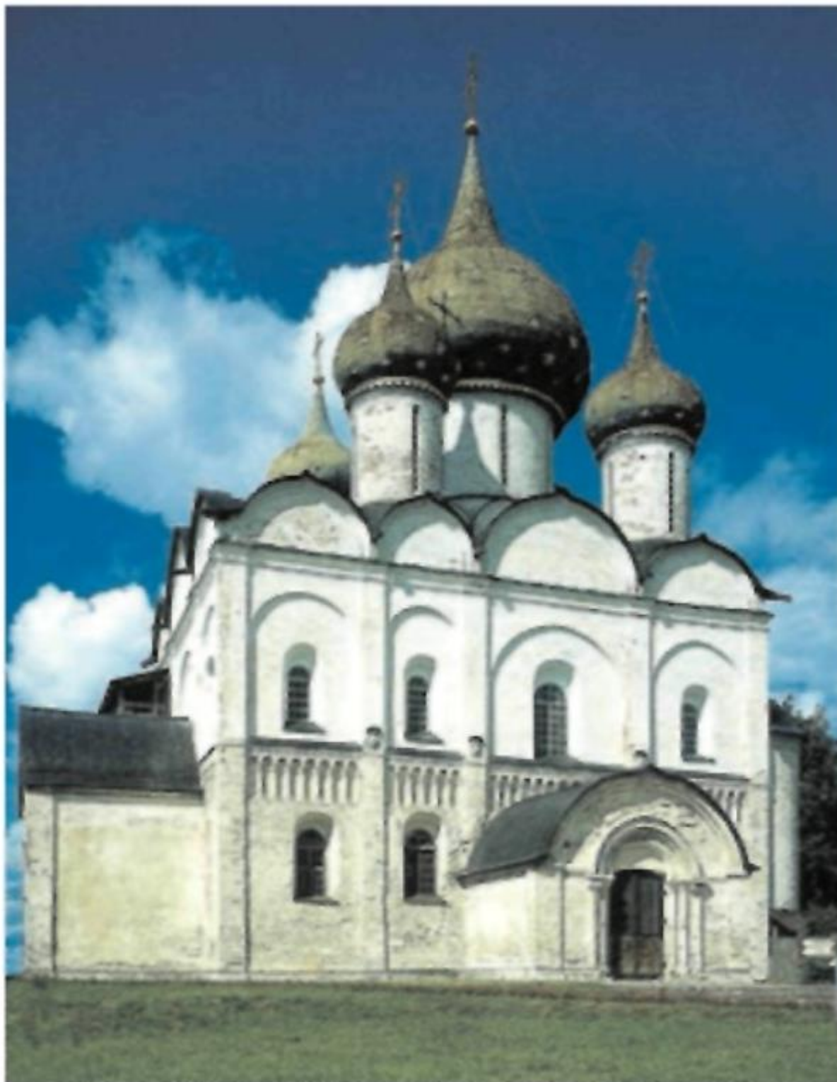
Рождественский собор в Суздале

Город Владимир при Андрее был укреплен новыми высокими валами и дубовыми стенами. Тогда же на въездах в город поставили Золотые, Серебряные и Медные ворота с надвратными часовенками: деревянные створы ворот были обшиты