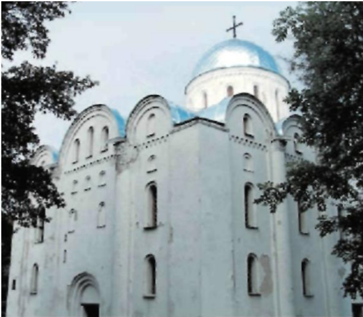
Борисоглебский собор в Чернигове

В архитектуре Черниговской земли прекрасно прослеживается развитие южнорусской архитектурной мысли. К примеру, Борисоглебский собор в Чернигове – типичная греческая постройка XII в. А церковь Праскевы Пятницы – образец храма нового типа. Она подобна башне, устремленной к небу.