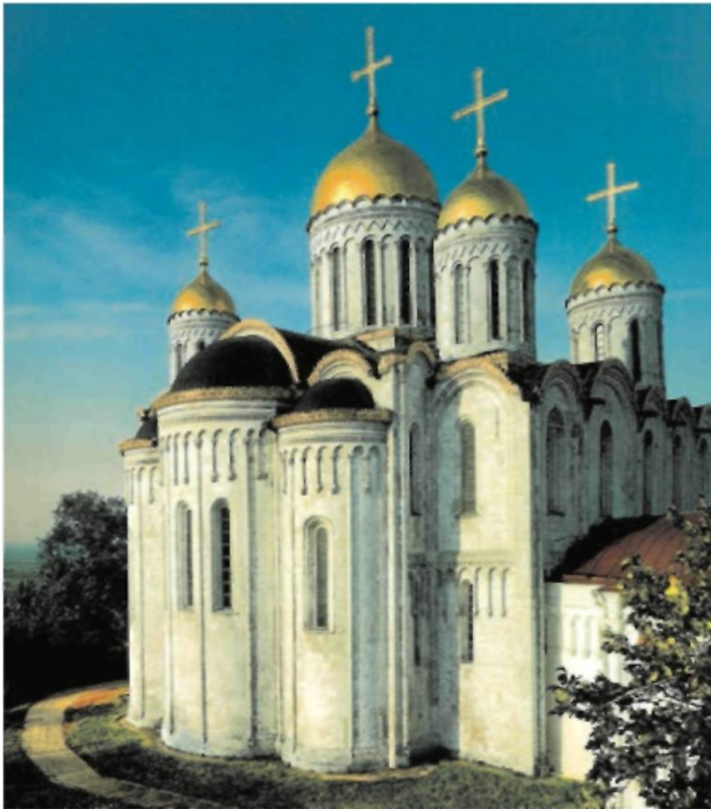
Успенский собор во Владимире

золоченой и серебряной медью, отшлифованными медными пластинами.