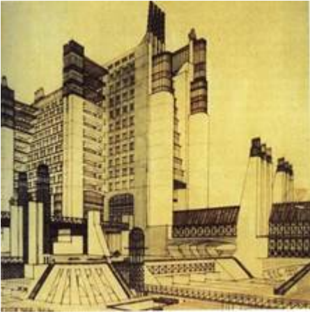
Сант Элиа, «Урбанистический рисунок»