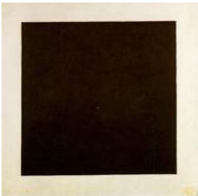
Малевич, «Черный квадрат», 1913