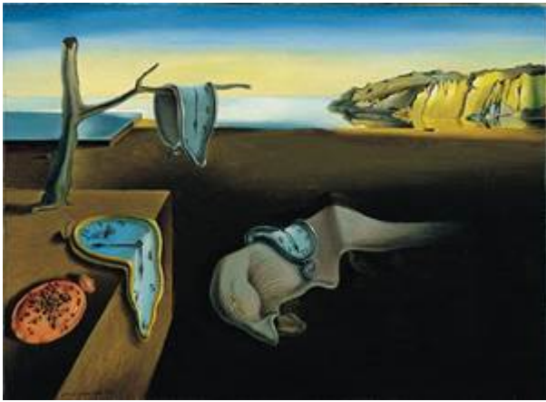
Дали, «Постоянство памяти», 1931