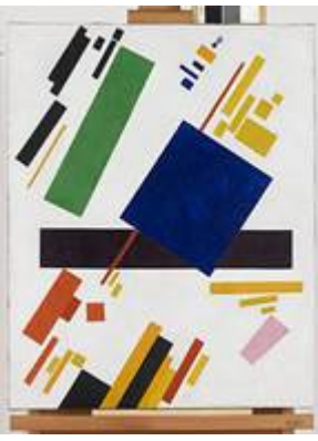
Малевич, «Супрематическая композиция», 1916