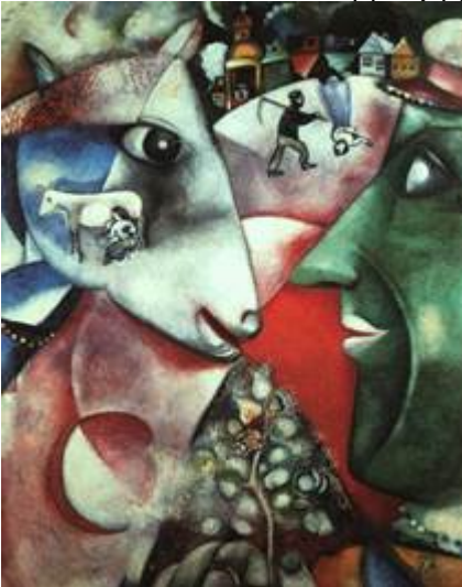
Шагал, «Я и деревня, 1911