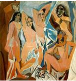
Пикассо, «Авиньонские девицы», 1907