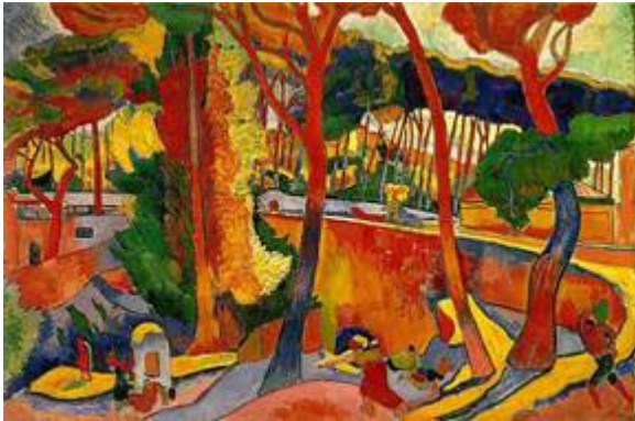
Дерен, «The Turning Road», 1906