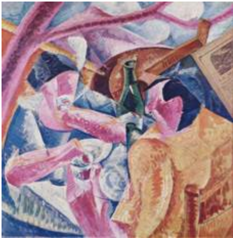
Боччони, «Под перголой в Неаполе», 1914