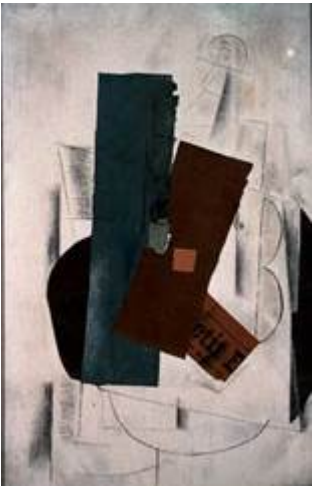
Брак, «Скрипка и газета»