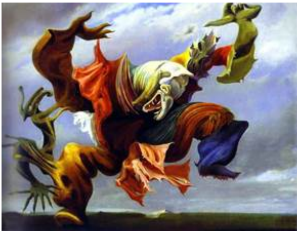
Эрнст, «Ангел очага или триумф сюрреализма»,