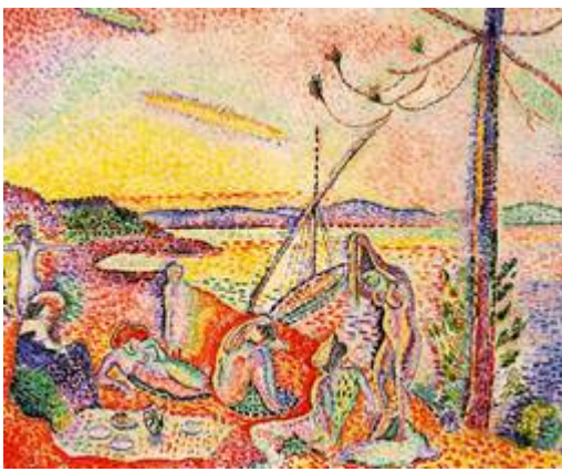
Матисс, «Luxe», 1904