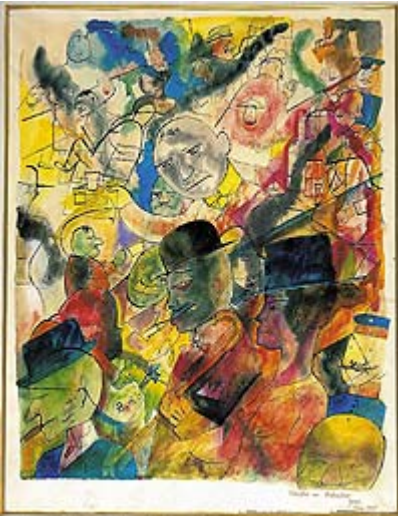
Гросс, «Люди в кофейне», 1918