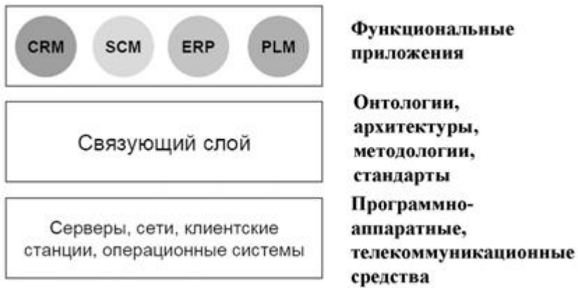
Рис. 1. Общая схема компоновки современной КИС

Для классификации систем нового поколения в некоторых источниках стали применять термин ERP-II и CSRP. Для окончательной формулировки для нового типа КИС, основных характеристик и осознания места в эволюции еще не пришло время.