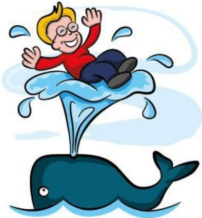
'Having a whale of a time.'