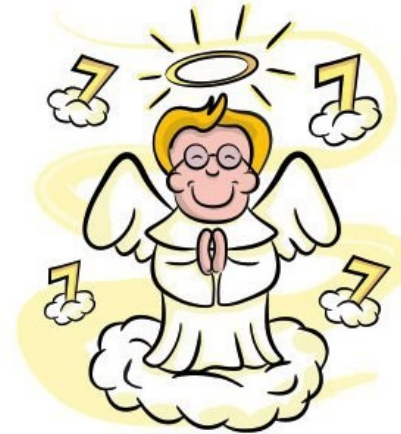
'In seventh heaven.'