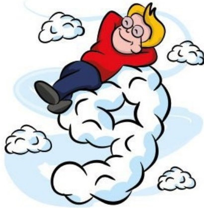
'On cloud nine.'