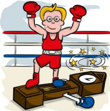
Beat the clock