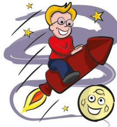
'Over the moon.'