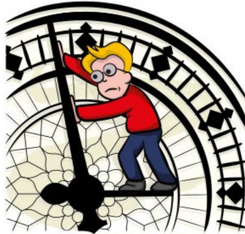
Turn back the hands of time