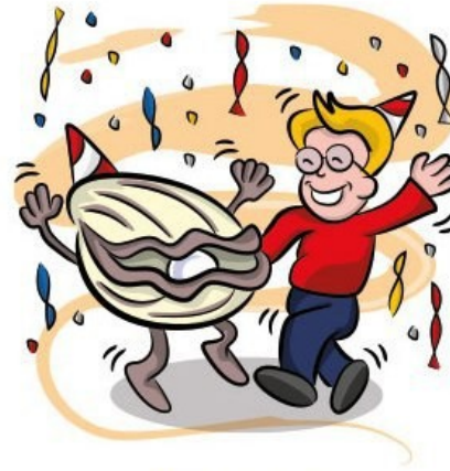
'Happy as a clam.'