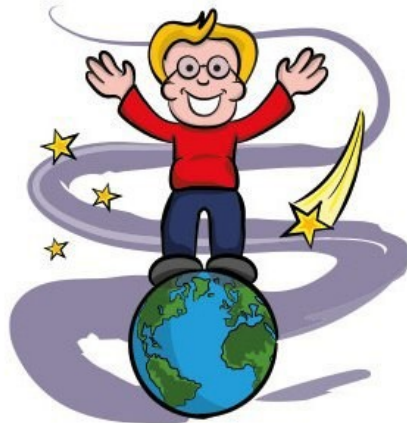
'On top of the world.'