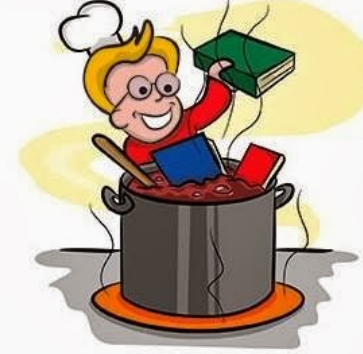
Cook the books