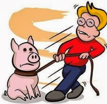
Bring home the bacon