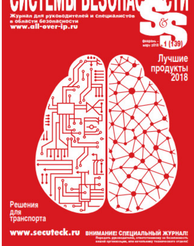
Рисунок. 5. Специальный журнал

Реферативные - в реферативном журнале основной текст состоит из перечня библиографических записей, сопровождаемых рефератами (рис. 6).