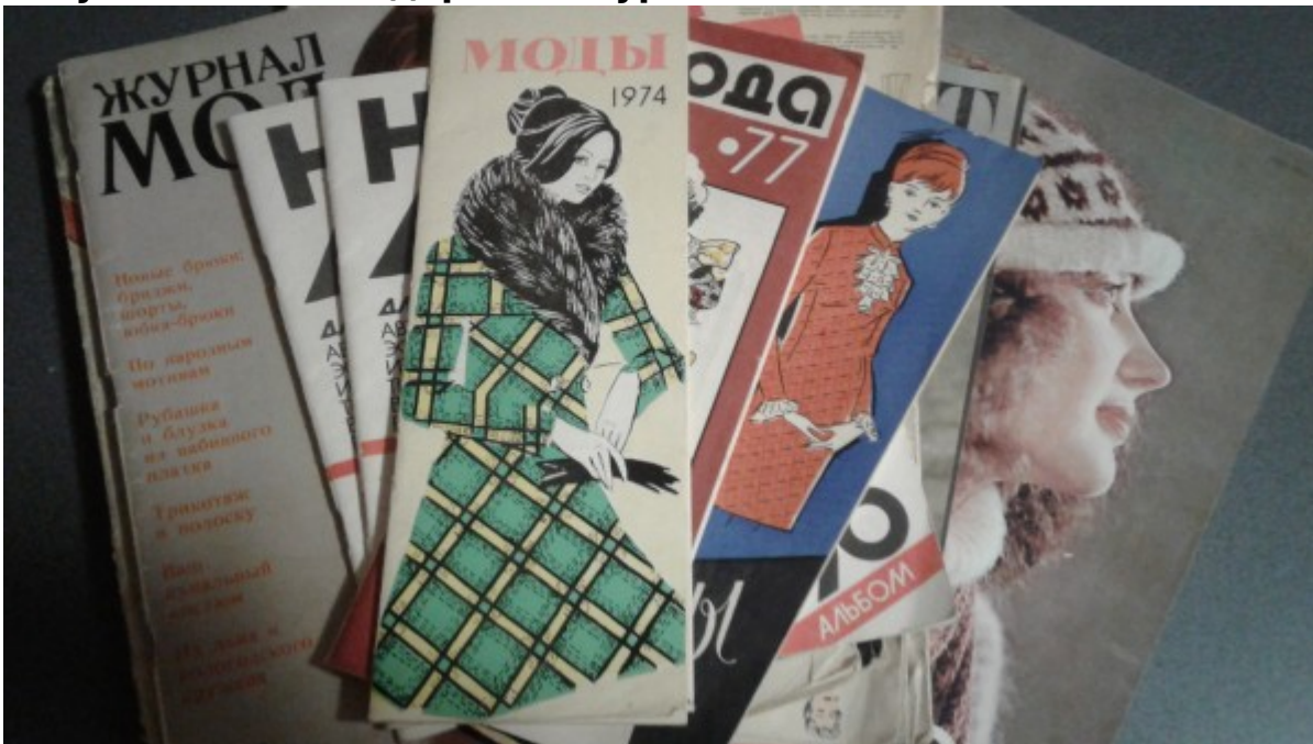
Рисунок. 7. Нестандартный журнал

Существует также ряд общепринятых издательских стандартов, в соответствии с которым журнальный формат - такой формат издания, который содержит ряд переплетенных страниц (количество которых кратно четырем, восьми, шестнадцати или тридцати двум), сфальцованных и обрезанных.