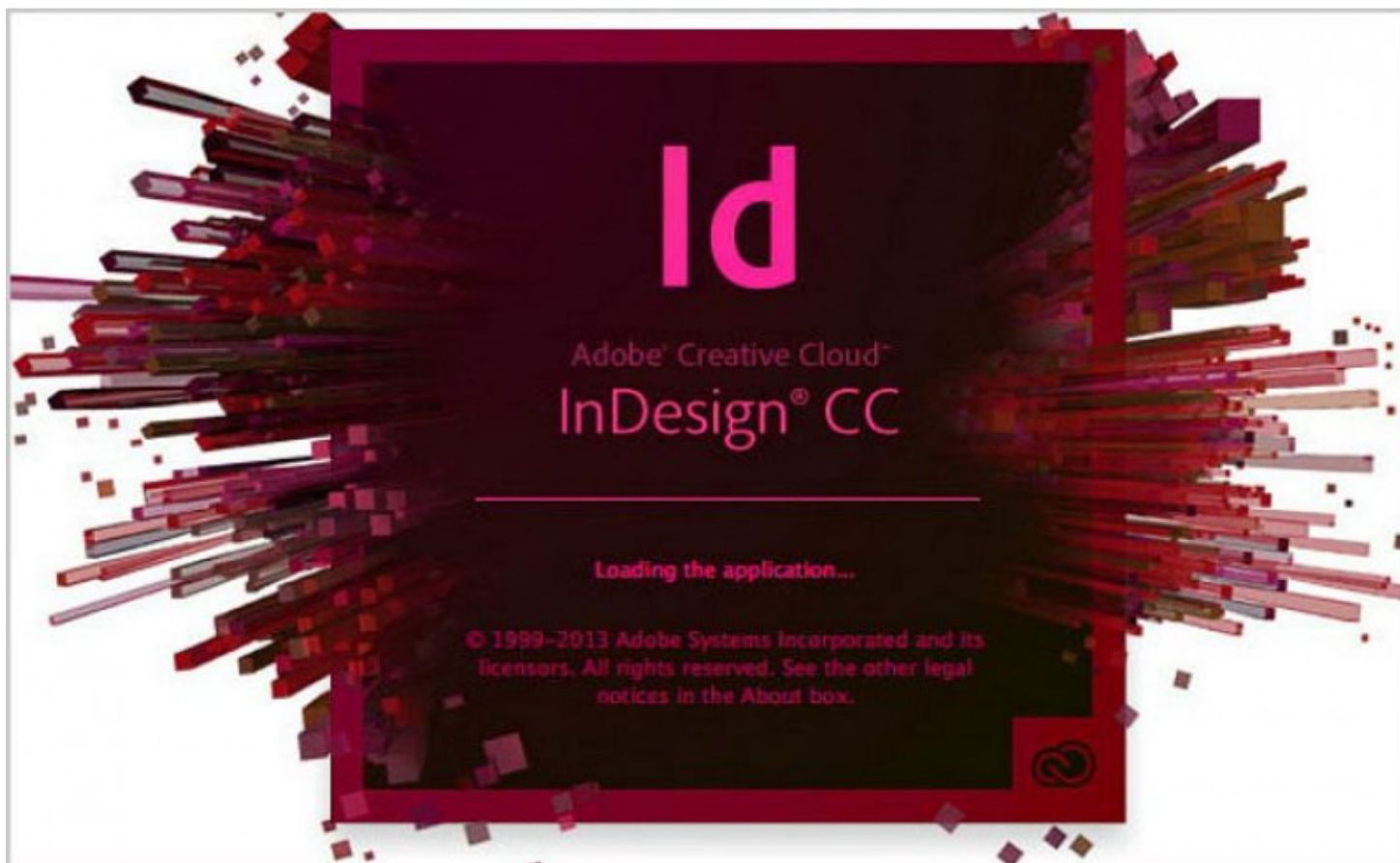
Рисунок. 8. Adobe

Профессиональный дизайнер просто обязан уметь делать верстку. Многие редакторы сегодня уже почти забыты. Вместо них используют программу для верстки - Adobe InDesign (рис.8).