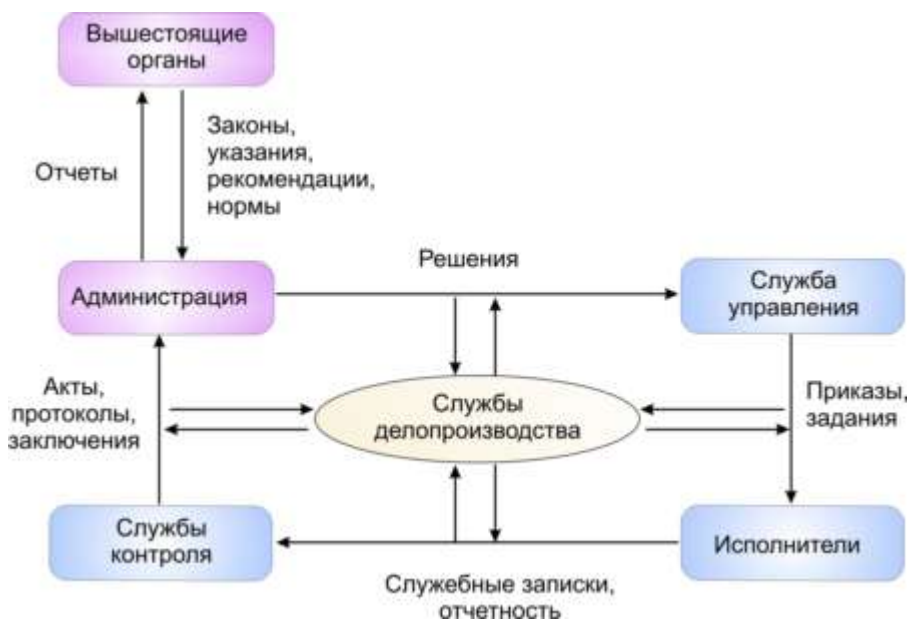
Рис. 1.3. Схема документационного обеспечения управления

Управление любым предприятием - это информационный процесс, в котором информация принимается, обрабатывается, вырабатывается решение, решение доводится до исполнителей, действия которых контролируются (рис. 1.3).