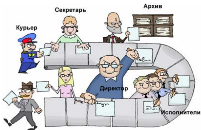
Рис. 1.4. Документооборот на предприятии

Организация документооборота имеет много общего с организацией механического конвейера (рис. 3.12). В свое время введение конвейерной сборки наряду с типизацией продукции и стандартизацией деталей привело к значительному росту производительности труда, снижению стоимости процесса производства и положило начало массовому производству. Правда, при этом ритм, задаваемый конвейером, привел к увеличению интенсивности труда и нервного напряжения работников.