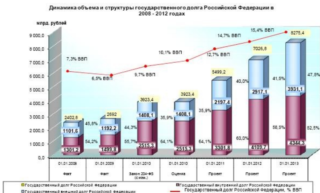
Рис. 1. Динамика объема и структуры государственного долга Российской Федерации в 2008 - 2012 годах

4 Счетная палата Российской Федерации. Заключение Счетной палаты Российской Федерации на проект федерального закона «О федеральном бюджете на 2010 год и на плановый период 2011 и 2012 годов». – Москва, 2010. – с. 194.