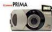
Вы никогда не забудете это чувство

Из более чем 40 моделей камеры Canon Prima Вы будете легко выбрать ту, что Вам нравится. Canon Prima — камера с отличным качеством!